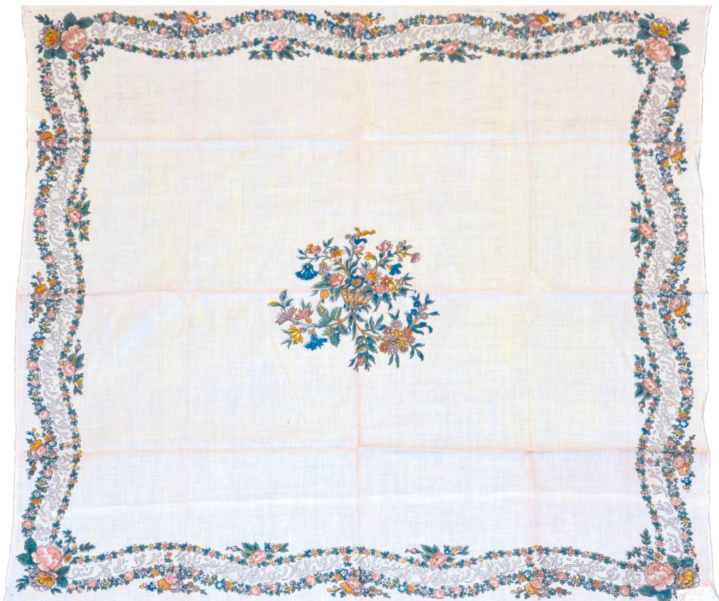
Ysmas-Tuch mit arabischen Schriftzeichen aus Glarner Produktion.

Die Schweiz unterhielt nie diplomatische Beziehungen zum Osmanischen Reich, und sie etablierte sich auch nie durch sogenannte Kapitulationen als Schutzmacht. Kapitulationen wurden vor allem von den Grossmächten abgeschlossen. Dabei handelte es sich um Verträge: Handelsprivilegien gegen Militärhilfe oder Tributzahlungen. Auch Angehörige anderer Staaten konnten sich freiwillig unter den Schutz solcher Kapitulationen begeben. Die Schweizer wählten mehrheitlich Frankreich und Österreich-Ungarn als Schutzmächte.