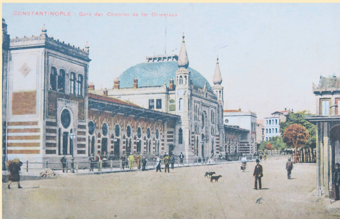
Der Bahnhof Sirkeci wurde eigens für den Orientexpress gebaut. Postkarte um 1900.

die Schweiz zurückgeschafft. Ein ähnliches Los erlitten viele schweizerische Arbeiter, die von den grossen Eisenbahnprojekten oder beispielsweise vom Suezkanalbau angezogen worden waren. Nicht selten liessen verstorbene Handwerker, Gewerbetreibende und Arbeiter Frauen und Kinder zurück, die sich dann nur mit grossen Schwierigkeiten zurechtfinden konnten oder in grosser Armut in die Schweiz zurückkehrten.»