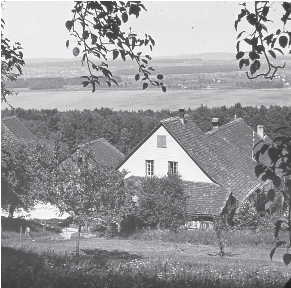
Der Hof Stuhlen, im Hintergrund der Greifensee, undatierte Aufnahme.

und in der Freiwirtschaftslehre wurzelnden Ideen auf. Auf dem Hof Stuhlen, wo sie vom Herbst 1915 bis zu ihrem Tod im Dezember 1967 lebte, führte sie während Jahrzehnten auch Kurse durch, sodass Stuhlen in der Zwischenkriegszeit zu einer «Lehrstätte für biologischen Land & Gartenbau» wurde, die Besucherinnen und Besucher weit über die Schweiz hinaus anzulocken vermochte.