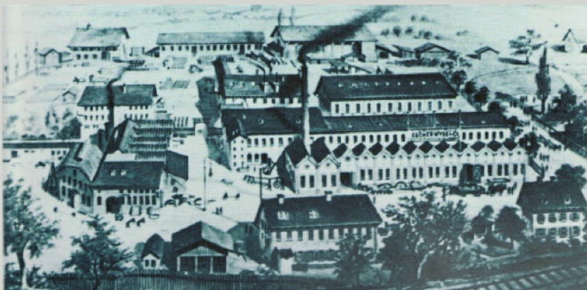
Escher Wyss & Cie. in Ravensburg.

Am 4. Juli 1861 teilt das Ministerium des Innern der Zentralstelle für Gewerbe und Handel mit, dass «seine Königliche Majestät durch höchste Entschliessung [...] den Fabrikanten Escher, Wyss u. Comp. zu Ravensburg auf eigenthümlichen Einrichtungen an mechanischen Webstühlen zur Buntweberei ein Erfindungs-Patent [...] ertheilt».