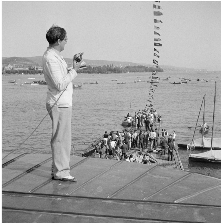
31. Mai 1936: «Halloooo? Hallo Hallooo? Hier die schwimmende Kurzwellenstation HB9J auf dem Zürcher unteren Seebecken. Lieber Hörer! Ein beinahe historischer Moment ist es für uns von Radio Zürich, wenn wir nun zum ersten Mal mit einer praktikablen Kurzwellenapparatur auf kurzen Wellen zu Ihnen sprechen können.»