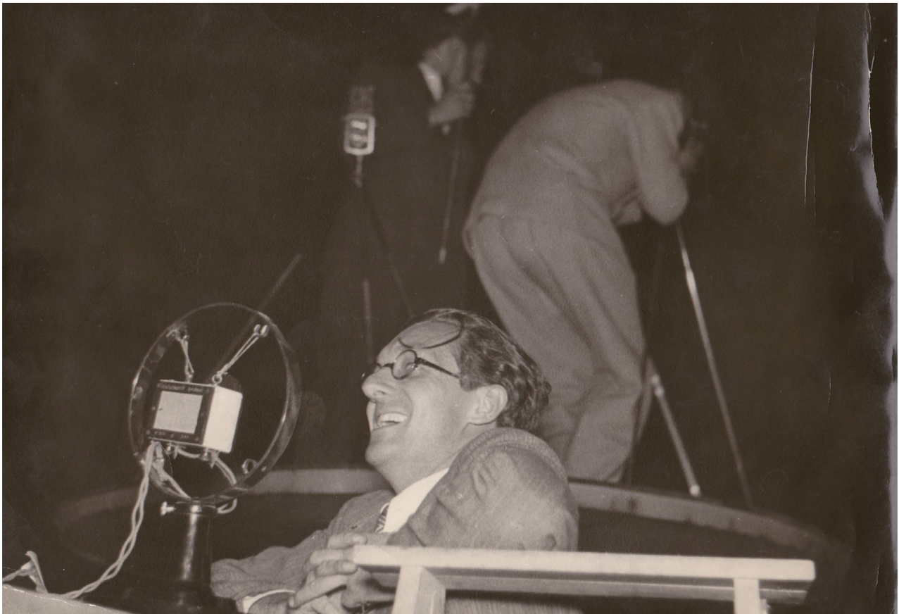
Dank dem nördlichen Nachbarn mit dem Monokel wurde doch noch alles gut! Arthur Weltis Reportage: Sechseläuten 1933.

flutlichen» technischen Hilfsmittel und schliesslich ein Spektakel für das radiohörende Publikum: Noch Jahrzehnte später gehörten Erinnerungen an jene Hörerlebnisse zum Aufregendsten, das man erzählt erhalten konnte.