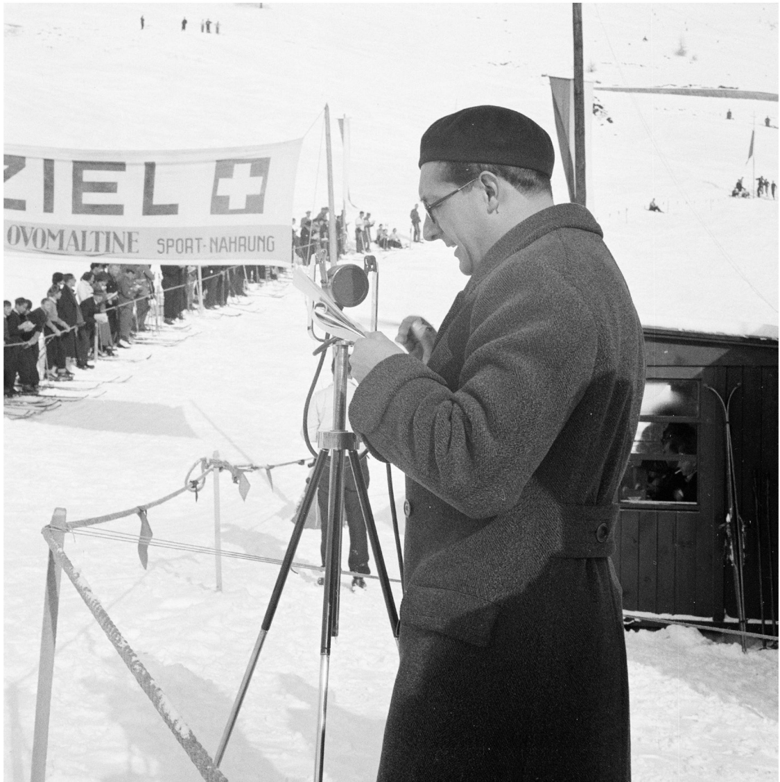
Live-Reportage von den 4. Akademischen Welt-Winterspielen in St. Moritz, 1935.

man die beiden zeitlich zusammen und übertrage man das Ganze im Radio, dann entstehe die Reportage. Die vom Reporter zu erfüllenden Forderungen seien Sachkenntnis und Redegewandtheit. Ausserdem müsse er noch über andere Qualitäten verfügen wie Natürlichkeit, gesunden Menschenverstand, Humor, Takt, und er müsse sympathisch sein, um als unsichtbarer Erzähler seine Zuhörer bannen zu können. Das genüge aber nicht. Man könnte zwar meinen, dass es bei Vorliegen der Grundanforderungen an den Reporter gar nicht so schwer sein müsste, z.B. ein interessantes Länderspiel zu reportieren. Solange etwas «passiert», sei es in der Tat wirklich nicht so schwierig, zu berichten. Schwierig werde es erst, wenn nichts passiere. Dann heisse es, zu «füllen». Beim Beispiel einer Skimeisterschaft, bei dem die Fahrer hintereinander ins Ziel fahren und es keine Gleichzeitigkeit des sportlichen «Dramas» wie beim Fussballmatch gebe, greife der Reporter darum oft zu anderen Mitteln als nur der direkten Reportage. Er bringe einzelne