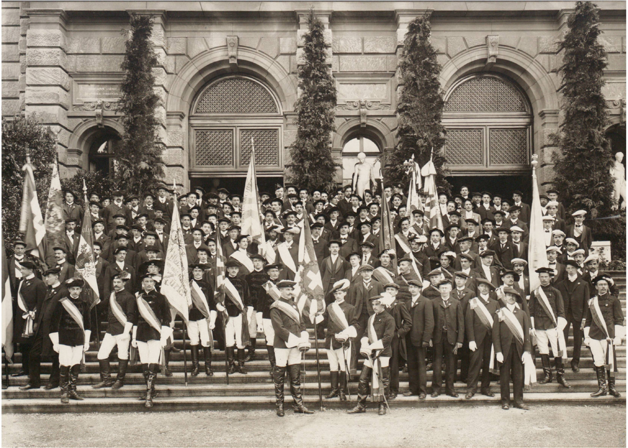
Festumzug zum ETH-Jubiläum 1905 mit 2000 Teilnehmern, hier Delegierte der Fach- und Nationalitätenvereine vor dem Hauptportal.