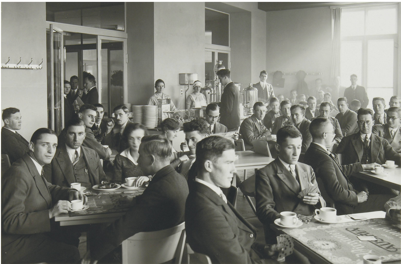
Das Café im Studentenheim an der ETH Zürich, 1930er-Jahre.

1939 betrieb der Schweizer Verband Volksdienst 100 Betriebe mit 700 Angestellten, darunter die Speiseanstalt der Schokoladenfabrik Lindt & Sprüngli in Kilchberg, die Kantinen der Omega Watch in Biel und der Migros in Zürich, etliche Lokale für Beamte der SBB und der PTT sowie einige temporäre Baukantinen. Bereits in den 1920er-Jahren ging man über die Grenze und führte Betriebe von Schweizer Firmen im grenznahen Ausland, wie die Werkskantine der Chemiefabrik Geigy im deutschen Grenzach. 1934 folgte sogar der Schritt nach London, wo der SV das Hotel «Foyer Suisse» im Besitz der dortigen reformierten Schweizer Kirche erfolgreich leitete. Vom deutschen Bombardement betroffen, musste das Hotel 1942 aufgegeben werden, womit das Auslandsengagement des SV sein vorläufiges Ende fand.