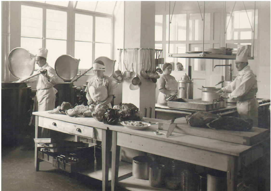
Vorbereitung der Mittagsmenüs in der Küche des ETH-Studentenheims.

Vorträgen und Demonstrationskursen zu Gemüseanbau und Hauswirtschaft. Daneben mussten die zivilen Betriebe weitergeführt, umgebaut und neue eröffnet werden. Um die Abläufe zu vereinfachen, gründete der SV 1940 eine eigene «Abteilung für Neueinrichtungen und Einkauf» (später Betriebsorganisation). Diese übernahm das Einrichten von Kantinen und den Einkauf oder die Auswahl von Küchengeräten und Inventar. Weil der Personalbestand des SV für die zivilen Betriebe und die vielen neuen Soldatenstuben nicht ausreichte, wurden die Soldatenmütter verstärkt vom FHD rekrutiert und eingesetzt, wobei gute hauswirtschaftliche Kenntnisse die Bedingung waren. Allerdings waren die Soldatenstuben im Zweiten Weltkrieg keine Domäne des SV mehr, wie Else Spiller im Jahresbericht 1944 ernüchtert festhielt. Andere gemeinnützige Organisationen und Frauenvereine mischten nun auch mit. Selbst die Truppen richteten Soldatenstuben ein oder Wirte taufte ihre Lokale in solche um.