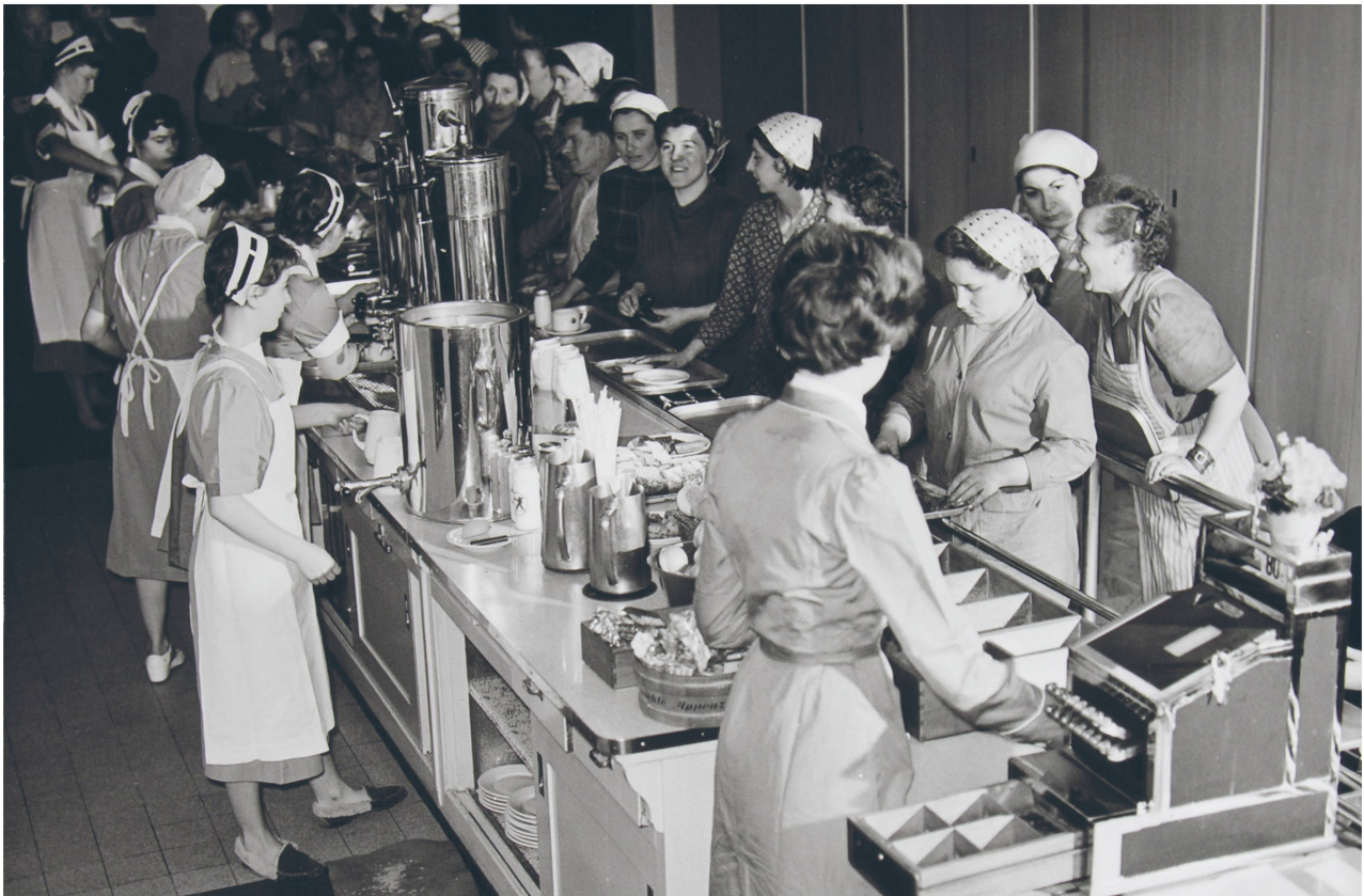
Kantine der Schweizerischen Bindfadenfabrik Flurlingen, 1930er-Jahre.

anderen Ländern nur als ferne Ziele erscheinen», schrieb sie in einer unveröffentlichten SV-Schrift von 1925.