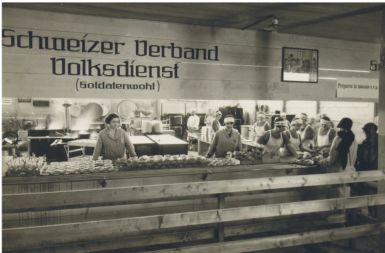
Bei der SAFFA 1928 in Bern machte der SV das Konzept der Selbstbedienung populär.