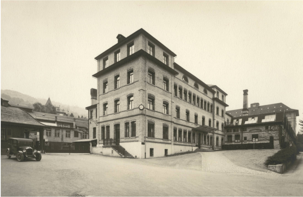
Das Theilerhaus nach einer weiteren Aufstockung und mit einem neuen Haupteingang in der Mitte, um 1918.