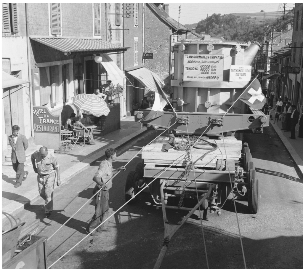
Szene aus dem Film «Transport eines Transformators», 1950.

Im Jahresbericht 1950 ist zu lesen, dass mit dem Auftragsfilm ‚Gesegnetes Land‘ für die Firma Wander AG,