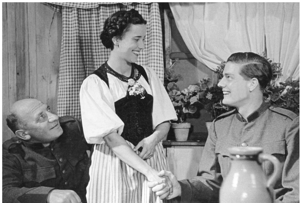
Szene aus dem höchst erfolgreichen Film «Füsilier Wipf». Von links: Heinrich Gretler, Lisa Della Casa und Paul Hubschmid, 1938.

Neben Heinrich Gretler, der seine erste grosse Filmrolle spielte, debütierten Paul Hubschmid und Lisa Della Casa. Alle packten mit an. «Heinrich Gretler schleppte noch den Proviant für die ganze Equipe im Rucksack zum Drehplatz am Grossen