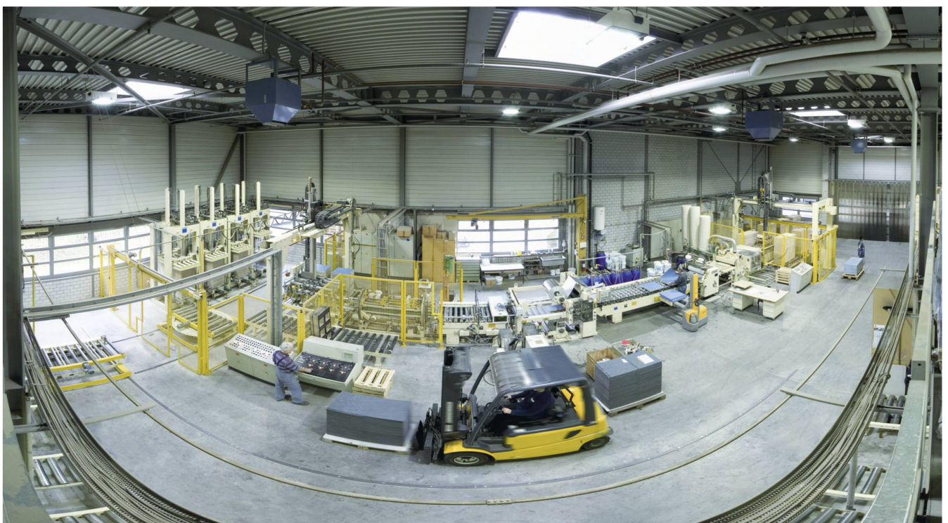
Eine Fabrikationshalle von Doppelbodenplatten in Uster.

Mittlerweile haben die Angestellten das offene Klima schätzen gelernt: «Es gibt mehrmals jährlich Gelegenheit, mit den Führungsleuten zu sprechen, zu diskutieren und Ideen einzubringen», heben die langjährigen Mitar-