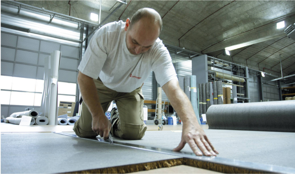
Beim Verlegen von Bodenbelägen ist nach wie vor Handarbeit gefragt.

nahm die Herausforderung bis zur Geburt ihres ersten Sohnes 1995. Anschliessend arbeitete sie einige Jahre Teilzeit, leitete verschiedene Projekte und bekam 1997 einen zweiten Sohn.