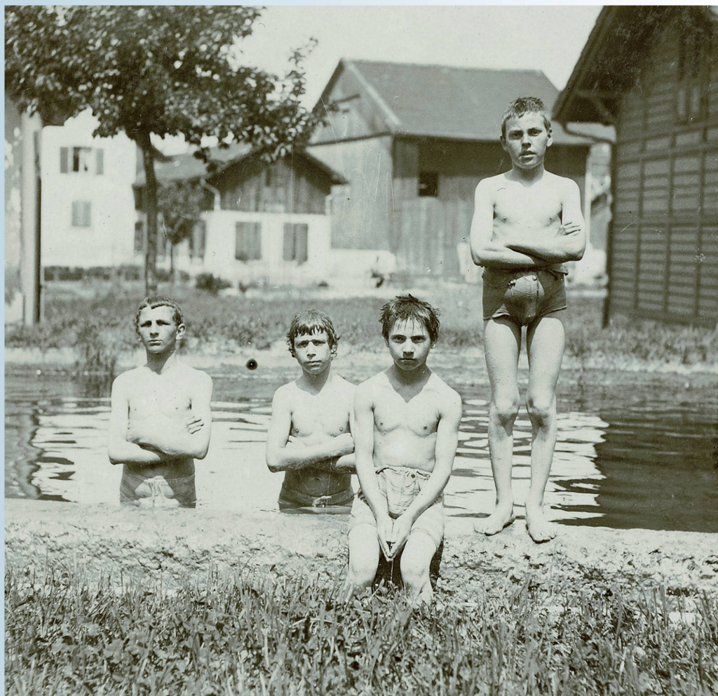
Baden im Fabrikkanal: Der Aabach diente um 1900 den Ustermer Jugendlichen auch zur Erfrischung.

bald aber immer stärker kanalisierten Bachs sehr begehrt und oft Gegenstand juristischer Gefechte. Gemäss Peter Surbeck, Kenner der Ustermer Geschichte, liegt die Besonderheit des Aabachs darin, dass er auf einer Länge von rund 10 km ein Gefälle von fast 100 m aufweist. Würde er mit diesem Gefälle weiterfliessen, hätte er bereits nach etwa 42 km den Meeresspiegel erreicht. Faktisch braucht das Wasser aber noch 700 km bis zum Meer. Dank diesem erstaunlichen Gefälle und der Tatsache, dass der Pfäffikersee gleichsam als grosses Rückhaltebecken dient, erhielt der eher unscheinbare Bach eine enorme wirtschaftliche Bedeutung. Die Aabachgemeinden wurden zu einem der am frühesten und am dichtesten besiedelten Industriegebiete Europas.