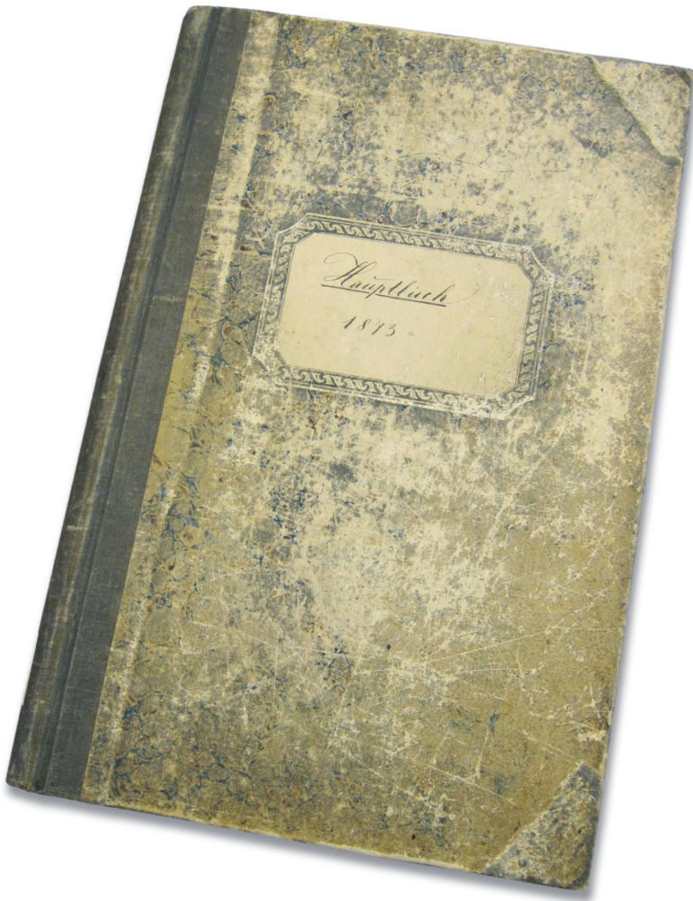
Joseph Lenzlingers Hauptbuch, 1873.

schichte der Unternehmerfamilie Lenzlinger noch lange eine wichtige Rolle spielen.