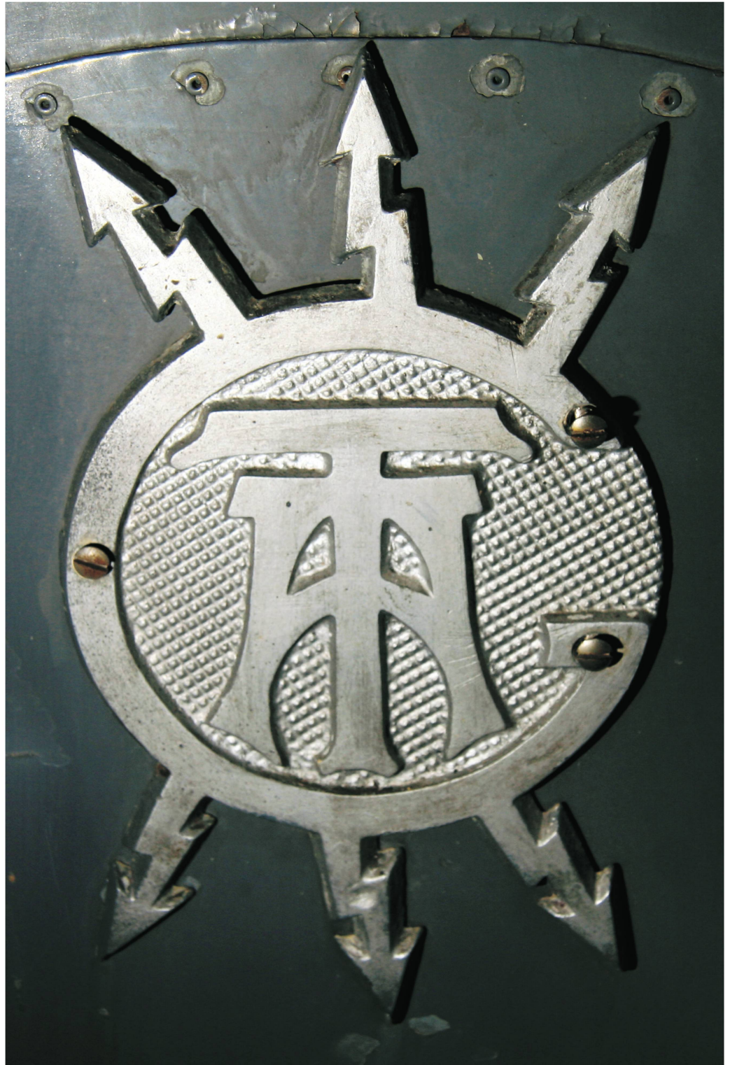
Tribelhorn-Logo des Schleppers von 1918 der Möbelfabrik Rüttimann, Siebnen, Sammlung Verkehrshaus. Diese Original-Plakette diente als Muster für die Restaurierung des Eptinger-Wagens, darum die nicht mehr vollständig festgezogenen Schrauben nach dem Wiederanbringen.