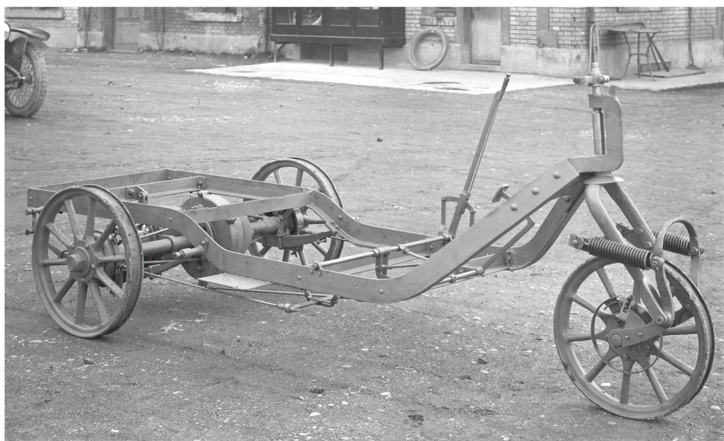
Ein durch die EFAG verbessertes Tribelhorn-Dreiradchassis für die Post, fotografiert an der Badenerstrasse 313 in Zürich.

Damit einher gehen jedoch prekäre Platzverhältnisse, eine «Höhlsituation», wie Sohn Leon Tribelhorn später dazu bemerken wird, denn Mitte 1925 steigt der Mitarbeiterstab weiter, auf 25. Die EFAG stösst an ihre räumlichen Grenzen, obwohl kaum etwas selbst produziert wird. Die meisten Komponenten stammen von Zulieferern, nur die Montage erfolgt vor Ort. Wenig ist über die erste Phase der EFAG an der Badenerstrasse erhalten geblieben, es gibt kaum Fotos und nur wenige Aufzeichnungen. Selbst Dokumente und Briefmappen werden schlicht überdruckt oder unter der alten Aufschrift «Tribelhorn AG – Altstetten» weiterverwendet. Der Bezug zur alten Firma ist gewollt, denn nach wie vor ist Johann Albert Tribelhorn die treibende Kraft.