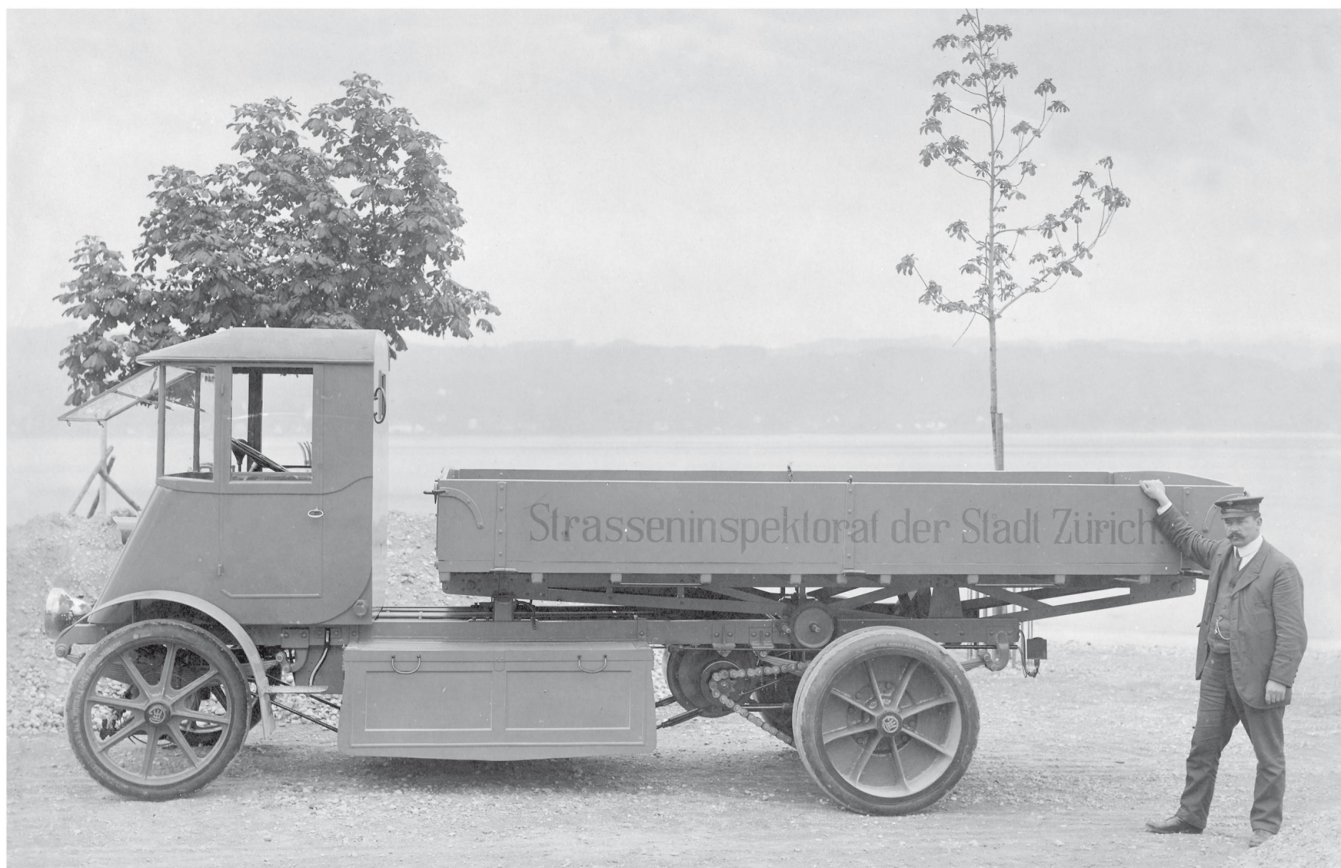
Tribelhorn mit einem Kettenwagen für das Strasseninspektorat Zürich. Er beliefert nebst zahlreichen Industriebetrieben vor allem die öffentlichen Dienste.

Schweizer Pionier für elektrische Automobile, er ist auch der erste Hersteller elektrischer Industriekarren und damit Begründer einer ganzen Fahrzeuggattung in der Schweiz. Noch Jahrzehnte später werden die Nachfolgegesellschaften Tribelhorns von dessen reichem Schaffen profitieren können.