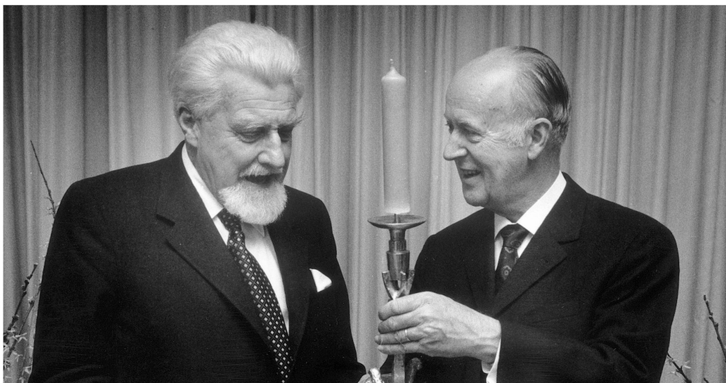
Verleihung des Kulturpreises der Stadt Zürich an Heini Hediger. Links: Laudator war der Nobelpreisträger Prof. Konrad Lorenz, 1974.

Durch seine professionelle Öffentlichkeitsarbeit gelang es Hediger, die Besucherzahlen deutlich zu steigern und dem Zoo öffentliche Geldquellen in bislang unbekanntem Ausmass zu erschliessen. Zugleich verlor der Zoo damit aber auch ein Stück seiner ursprünglich angestrebten Eigenständigkeit. Dass der Zoo trotzdem mehrheitlich Defizite schrieb, sorgte ihn als Wissenschaftler weniger. Als streitbare Persönlichkeit scheute er keine Konflikte und setzte seine Überzeugungen kompromisslos durch. Dies machte sein Leben nicht einfacher, es diente aber immer der Sache. Insgesamt ist es Heini Hediger gelungen, den Zoo Zürich zu einer Institution mit wissenschaftlichem Renommee weiterzuentwickeln und auch international bekannt zu machen.