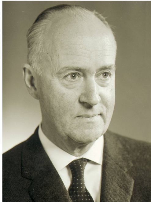
Der dritte Zoodirektor Heini Hediger, um 1970.