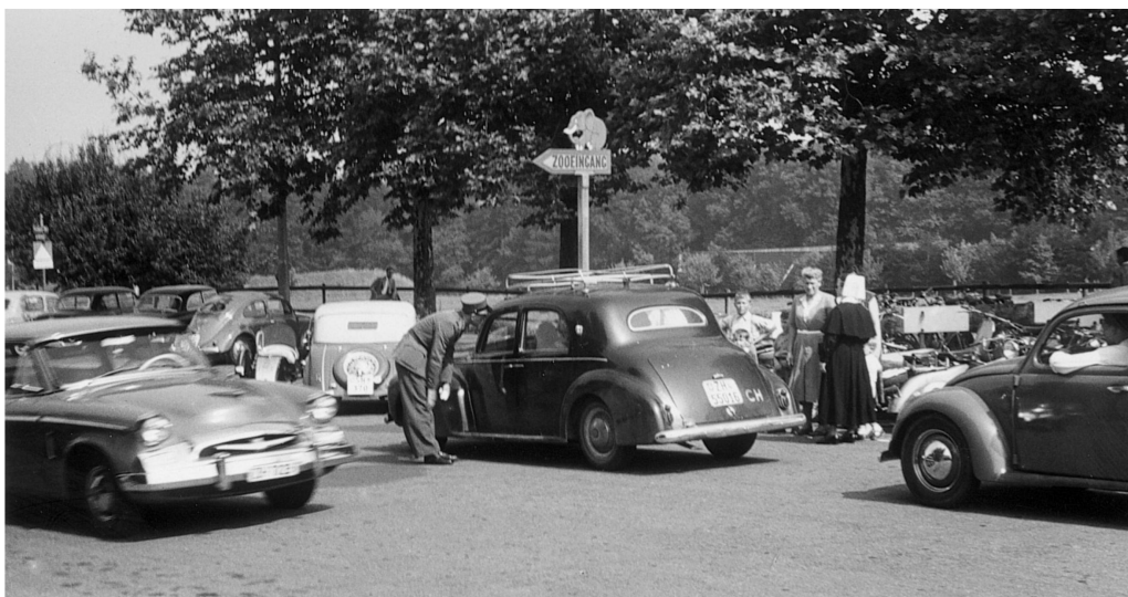
Parkplatznot beim Zoo Zürich: Ein altbekanntes Phänomen, Aufnahme von 1954.