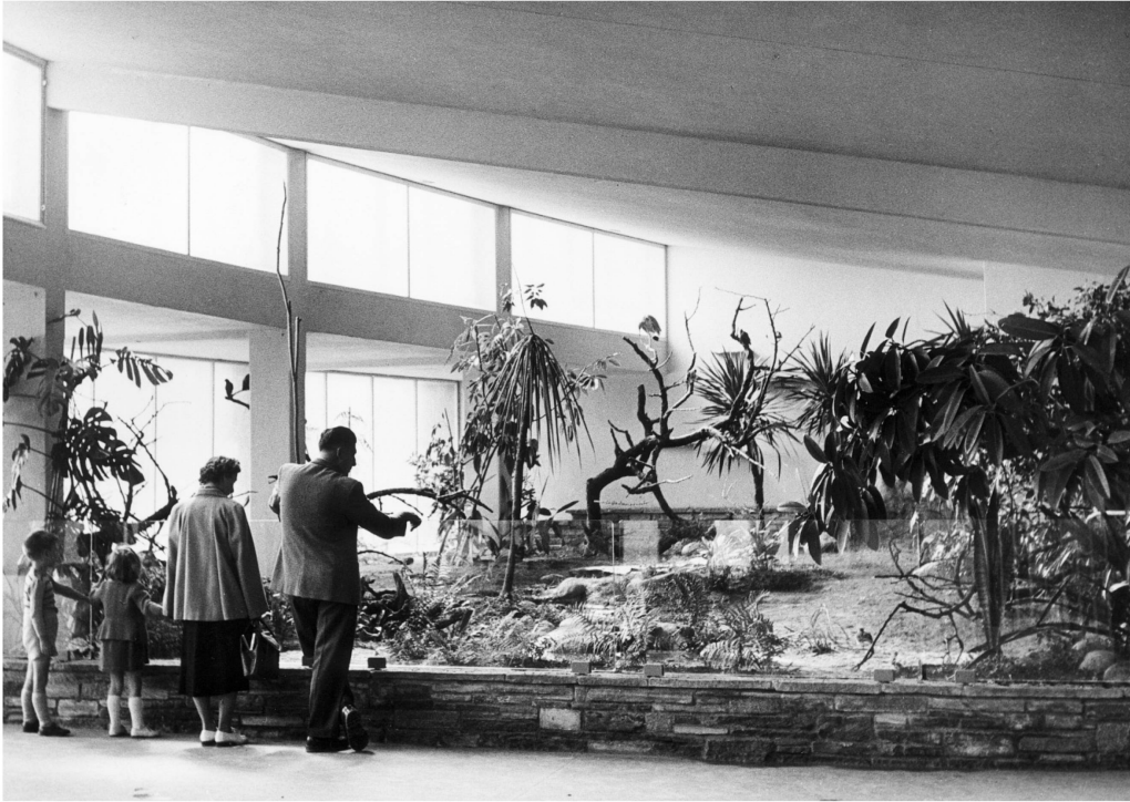
Dieser Freiflugraum im Hauptgebäude des Zoo Zürich war in Europa neuartig, 1954.

richtig, aber ohne seine Vorgesetzten und Mitarbeiter wirklich einzubinden. So kam es auch in Basel zu Konflikten.