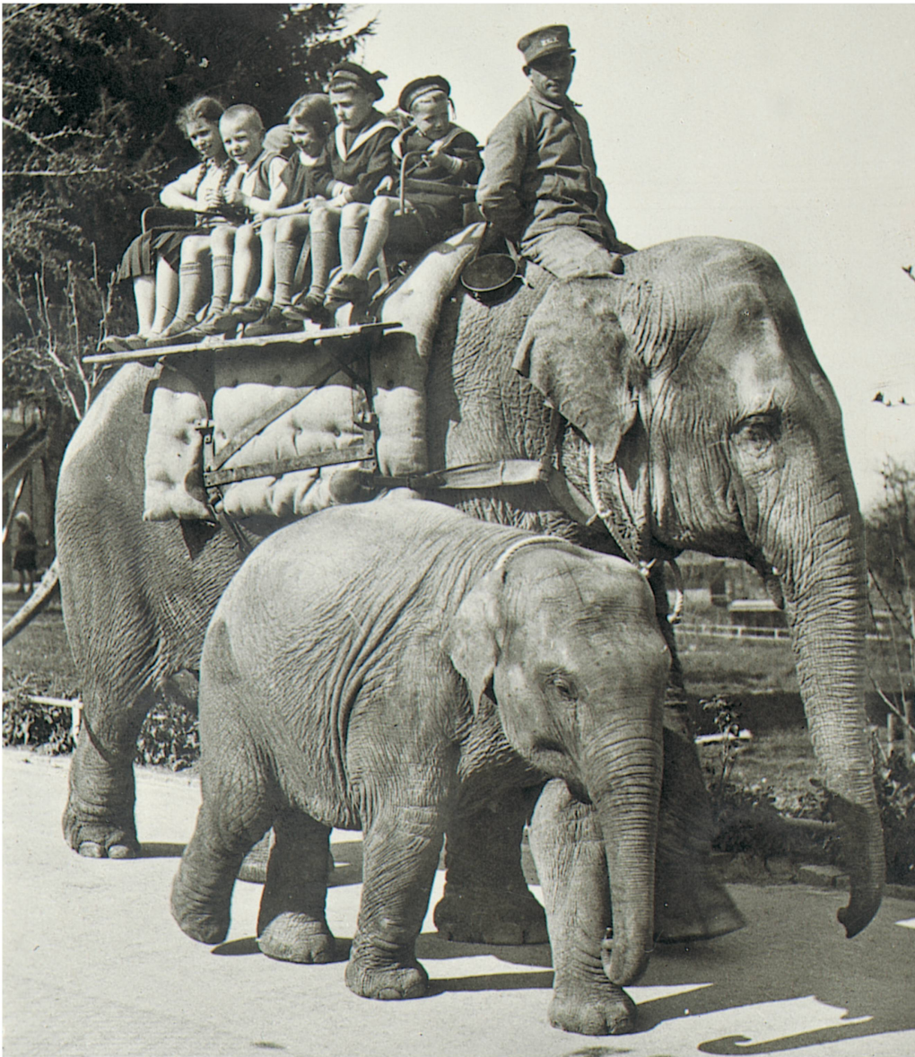
Kinder-Elefantenreiten auf «Mandjullah», 1939: Die Rampe dafür stand beim alten Restaurant «Säntisblick», wo sich auch der Kiosk und ein kleiner Spielplatz für die wartenden Kinder befanden. Ein Ritt kostete 25 Rappen.