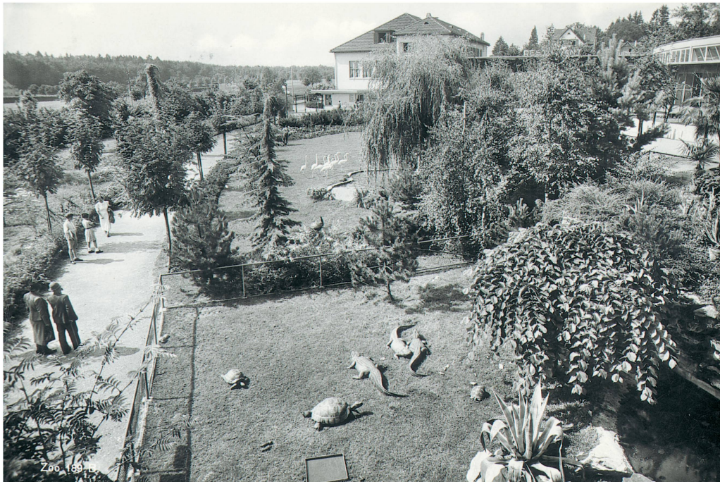
Krokodile und Riesenschildkröten im Freigehege, im Hintergrund Eingangsbereich und Zoo-Restaurant, 1939.

Besucher anzulocken. Auch wurden die Billettpreise leicht angehoben. Erwachsene zahlten 1.10 Franken, Kinder und Militär 55 Rappen, inklusive Billettsteuer. Eine Jahreskarte kostete für Erwachsene 33 Franken.