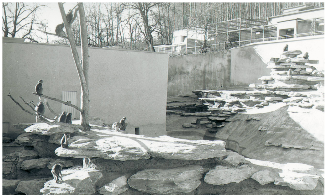
Affenfreianlage mit Rhesusaffen aus Indien im unteren Teil und Mantelpavianen aus Abessinien im höheren Teil. Felsaufbau aus roten Glarner Sernifitplatten. Oberhalb das Raubtierhaus, 1938.

Eine Zoo-Besucherin, so wird überliefert, regte sich auf, dass die Raubtiere mitten in der Rationierungszeit mit Fleisch gefüttert wurden. Als der Pfleger nach einer Fütterung das Gehege verliess, angelte die Frau mit ih-