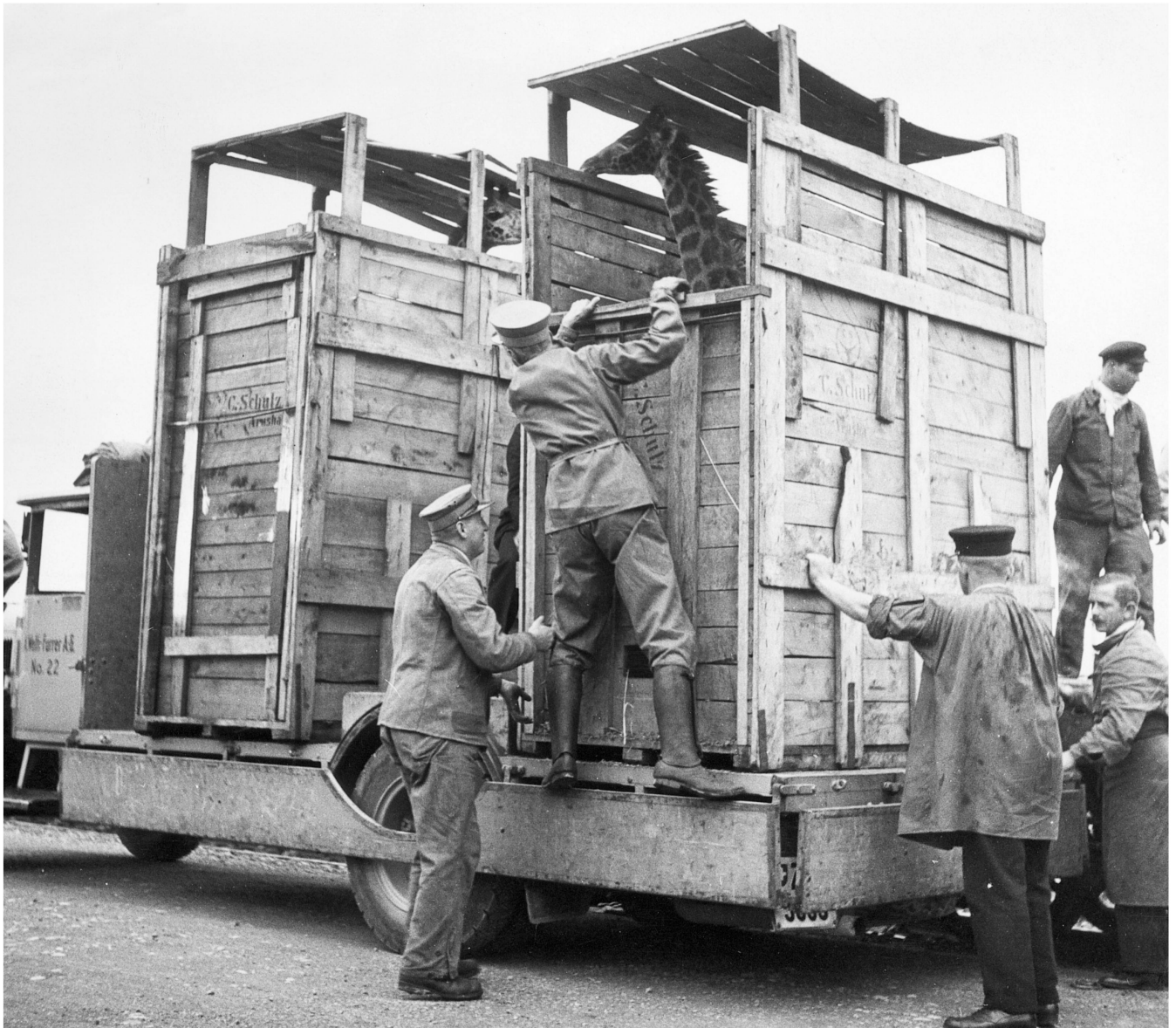
Ankunft der Giraffen «Sultan» und «Arusha» von der Firma Schulz aus Arusha für den Zoo Zürich am Zürcher Güterbahnhof, 1935.

sung finde, um mehr finanzielle Mittel zu generieren, «damit der schöne, mit soviel Liebe und vorbildlichem Bürgersinn geschaffene Garten sich in absehbarer Zeit würdig an die Seite der besten hauptstädtischen Tiergärten des Europäischen Festlandes stellen kann».