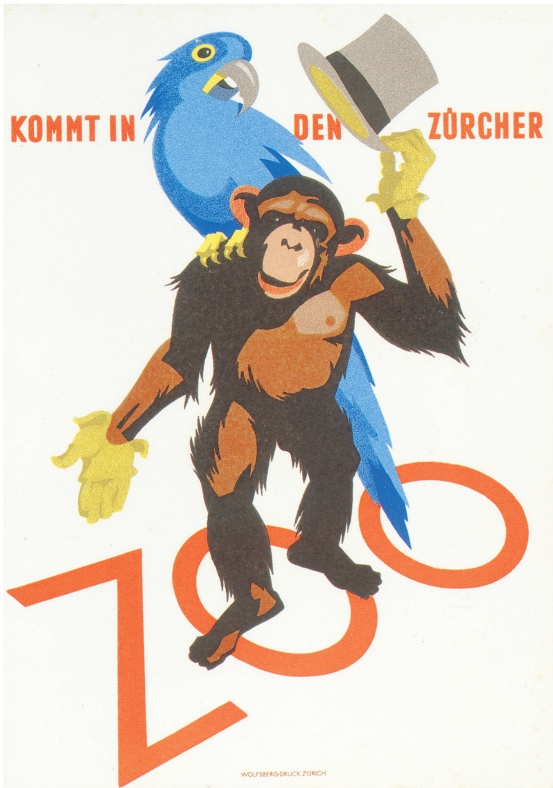
Zoo-Plakat von Rudolf Wening, 1939.