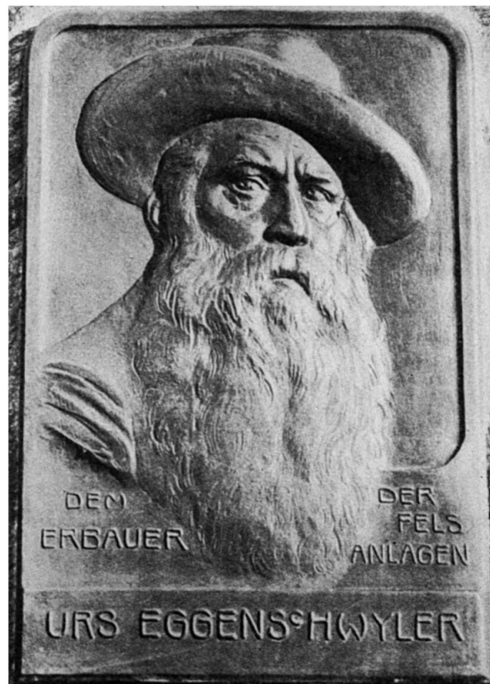
Gedenktafel für Urs Eggenschwyler im Tierpark Hagenbeck in Hamburg.

Dank dieser Summe konnte Eggenschwyler 1891 seinen grossen Traum realisieren: Er pachtete ein Stück Land auf dem Milchbuck im heutigen Quartier Unterstrass. Dort, am Tiefegässchen 7, zwischen der heutigen Pauluskirche und der Bruder Klaus-Kirche, richtete er hinter dem ehemaligen Restaurant Freihof eine Menagerie ein. In den selbstgebauten Käfigen und Bretterställen konnte er nach der Eröffnung bereits ein Dromedar,