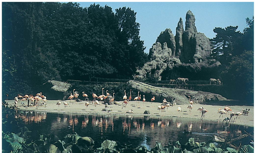
Die bis heute markanten Felsbauten von Urs Eggenschwyler im Tierpark Hagenbeck.

Am 5. Mai 1907 eröffnete Hagenbeck sein «Tierparadies» in Stellingen bei Hamburg. Seine Erfindung des gitterlosen Zoos gilt als Revolution in der Tiergartenarchitektur und wirkte weltweit vorbildhaft. Dass Hagenbecks Tierpark zu solch einem weltweit beachteten Erfolg werden konnte, ist auch Urs Eggenschwyler