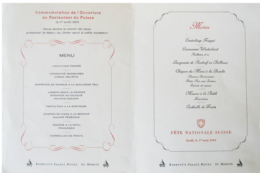
Menükarte des Palace Hotels vom 1. August 1963.