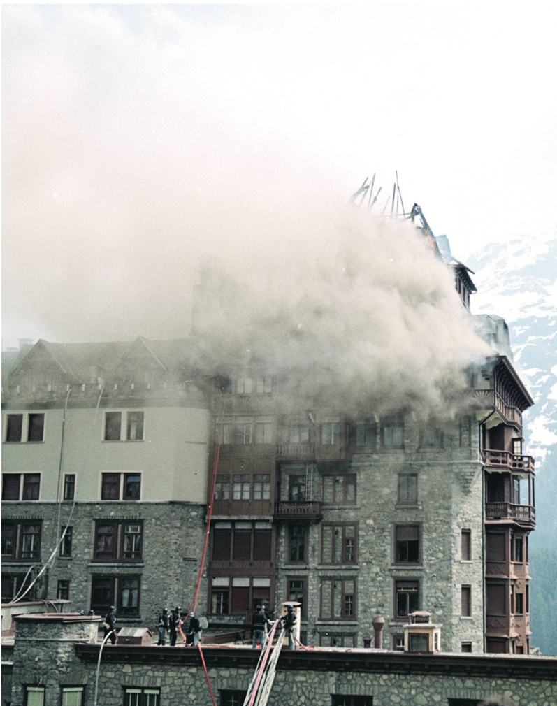
Der Turmbrand im Palace Hotel am 24. Juni 1967.