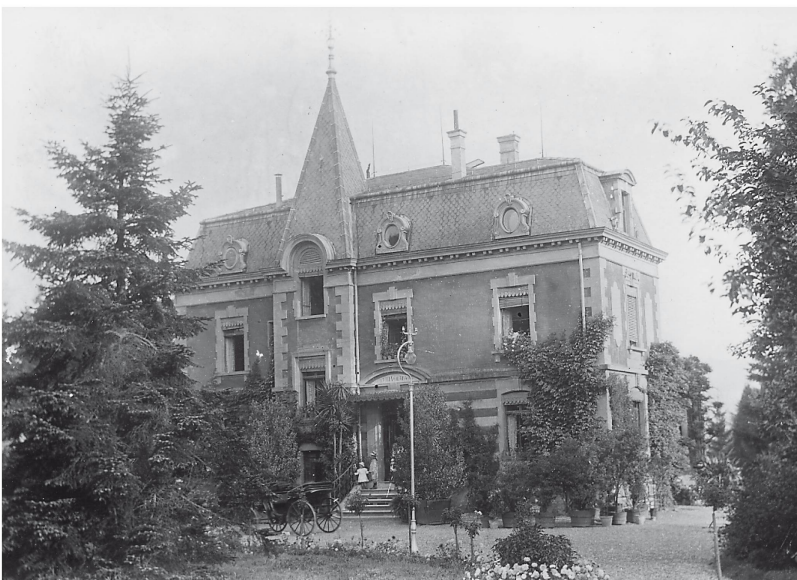
Villa Olinda in Aarau inmitten reicher Vegetation