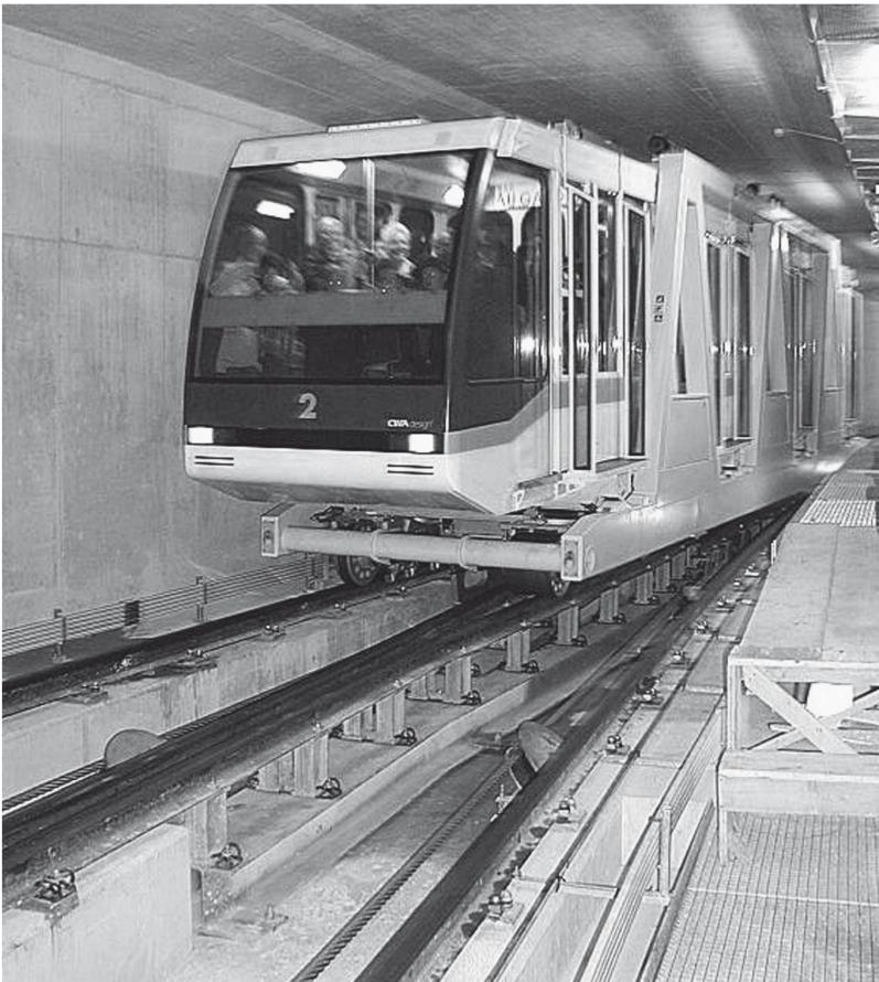
Erste Standseilbahn mit Niveau-Ausgleich: Stadtbahn Neuchâtel, 2002.

de. 1908 wurde der Betrieb mit zwei je 16 Personen fassenden Kabinen auf der Sektion Grindelwald-Enge – sie blieb der einzige Abschnitt der ursprünglich geplanten vier Sektionen auf den Wetterhorngipfel – aufgenommen; 1915 musste der Betrieb, durch das Ausbleiben der Fahrgäste bedingt, aufgegeben werden.