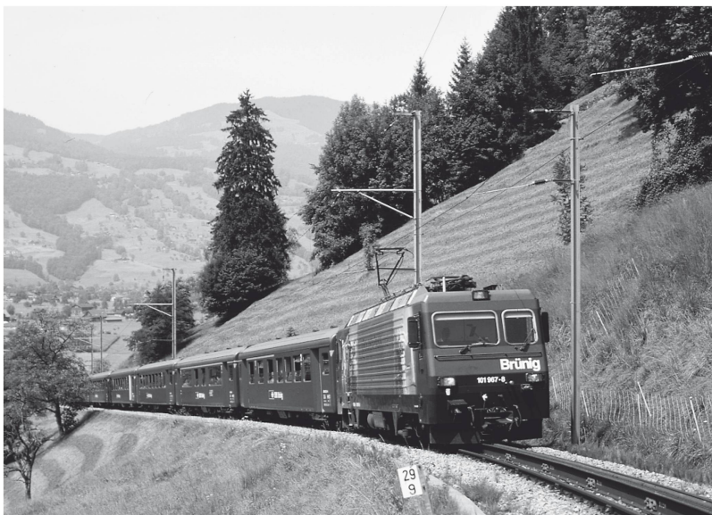
Gemischter Adhäsions- und Zahnradbetrieb, Zentralbahn (Brünig).

Zu den weltweit ersten derartigen Bahnen gehörte die 1877 eröffnete Standseilbahn Lausanne-Ouchy, die inzwischen zu einer Zahnradbahn umgebaut worden ist. 1879 folgte die Giessbachbahn, als erste Wasser-Übergewichtsbahn der Schweiz. Neuheiten brachten 1888 die Bürgenstockbahn, als erste mit elektrischem Antrieb, sowie die Stanserhornbahn, bei der anstelle der Zahnstangenbremse eine Zangensicherheitsbremse eingebaut wurde. In der Schweiz, die über ein besonders dichtes Netz von Standseilbahnen verfügt, sind auch jene mit den grössten Steigungen anzutreffen, wie etwa die Rittombahn mit 878 Promille oder die Gelmserseebahn mit 1058 Promille. Hier verkehrte bis 1970 auch die längste Seilbahn der Welt, die 4254 Meter lange Sierre-Montana-Crans-Bahn. Im Gegensatz zu den Zahnradbahnen wurden auch in den Dreissi-