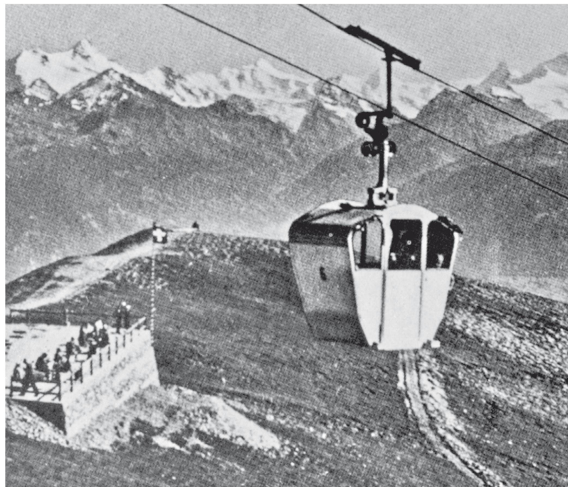
Erste Zweiseil-Gondelbahn, Crans-Cry d'Er, 1950.

burg erbrachten in der Frühzeit des Seilbahnbaus zum Teil Pionierleistungen. Viele von ihnen haben den Seilbahnbau eingestellt. Führendes Unternehmen ist nun die Firma Garaventa in Goldau, die, zusammen mit der österreichischen Firma Doppelmayr, zugleich auch weltweit der bedeutendste Konstrukteur und Hersteller von Luftseilbahnen ist.