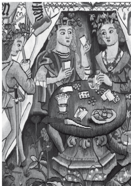
Liebespaar beim Kartenspiel auf einem Wirkteppich aus Basel (um 1470)

Nicht nur die weltliche Obrigkeit wandte sich gegen das Kartenspiel, das vor allem wegen der oft hohen Geldeinsätze als verwerflich galt. Auch die Kirche verurteilte die Spielkarten als «Bilderbuch des Teufels». Ein Holzschnitt des Nürnbergers Hans Schüfelein aus dem Jahre 1519 zeigt, wie nach den Auftritten des Buss- und Wanderpredigers Johannes Capestranus (1386–1456) Brettspiele und Spielkarten öffentlich verbrannt wurden. Auch der in Schaffhausen geborene Johannes Geiler von Kaysersberg (1445–1510), am Dom in Strassburg tätig und einer der bedeutendsten Sittenprediger seiner Zeit, missbilligte das unchristliche Tun. So genannte Narrenbücher glossierten das Kartenspiel, um auf mehr oder weniger hei-