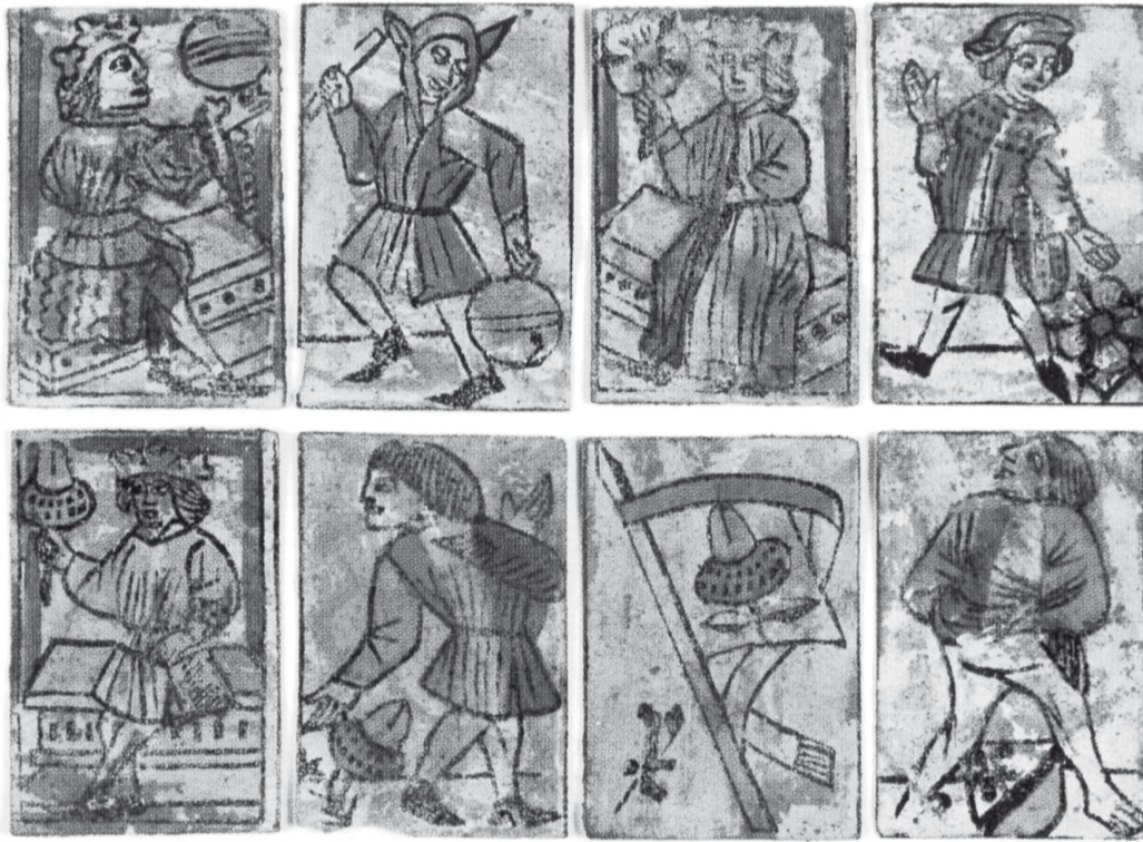
Spielkartenfragmente aus der Zeit um 1530, die als Makulatur zur Verstärkung eines Buchdeckels verwendet wurden

tere Art die Leute vor diesem Laster zu warnen. Das bekannteste Werk ist das «Narrenschiff» von Sebastian Brant, erschienen in Basel 1494.