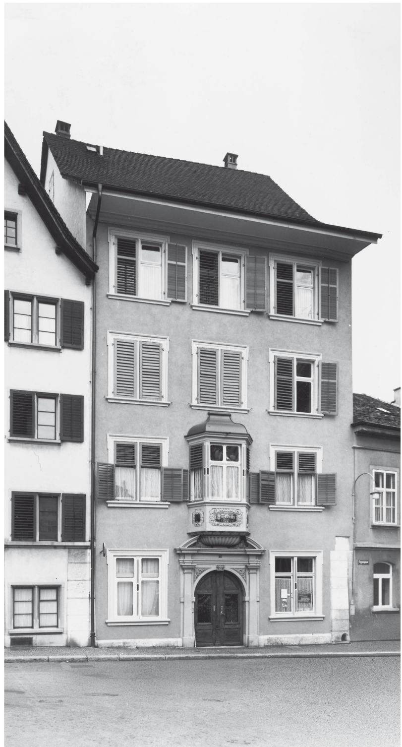
Haus «zum Korallenbaum» am Herrenacker in Schaffhausen