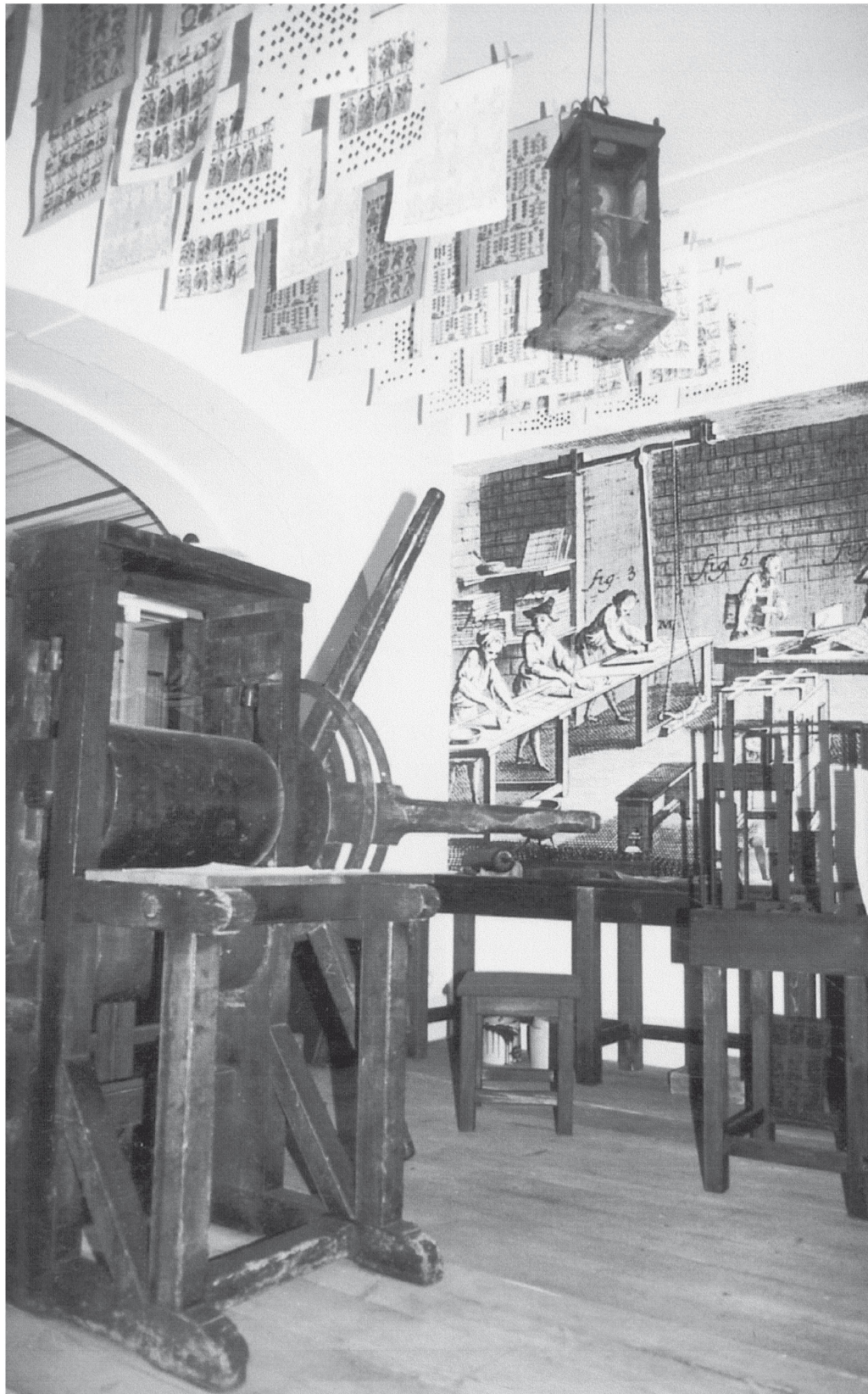
Kartenmacherwerkstatt Ende 18. Jahrhundert (Spielkartenmuseum Altenburg/Thüringen)

Schaffhausen erhob ab Oktober 1803 im Gegensatz zu den meisten anderen Kantonen keine Spielkartensteuer mehr. Im Kanton Wallis hat sich die Stempelsteuer bis auf den heutigen Tag erhalten.