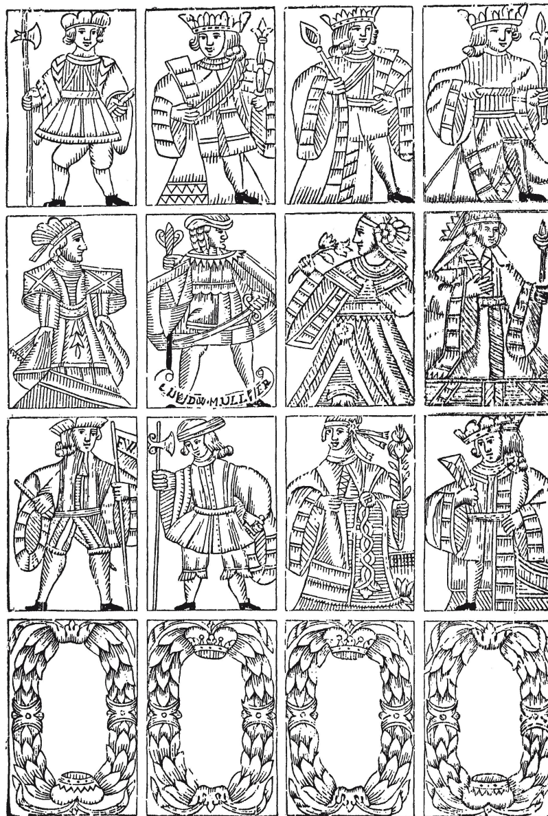
Holzmodel-Abdruck der Figuren eines französischschweizerischen Kartenspiels von Ludwig Müller

In der Helvetischen Republik sah erstmals ein Gesetz vom 17. Oktober 1798 die Spielkartenbesteuerung vor; eingeführt wurde sie jedoch erst im Februar 1799. Den Kantonen wurden zuhanden der Kartenmacher gestempelte Papierbändchen, so genannte «Riemli», in zwei Ausführungen (für gewöhnliche Kartenspiele und für Ta-