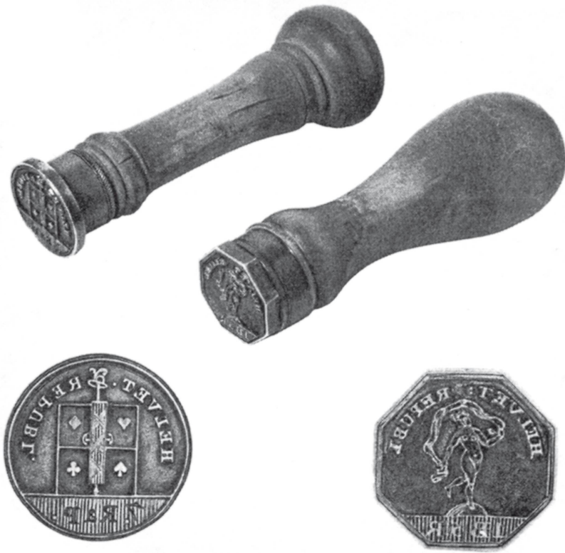
Handstempel für Spielkartensteuer, links für gewöhnliche Karten, rechts für Tarocke

Sou (5 Rappen) pro Spiel erhoben wurde, so waren jetzt für «gewöhnliche» Spiele zwei Rappen mehr zu bezahlen, während sich der Satz für Tarockspiele mit 15 Rappen gar verdreifachte. Ende März erhielten die kantonalen Behörden die nötigen Instruktionen zugesandt. Es galt, «alle Spielkarten, die gegenwärtig in Helvetien sind», zu stempeln. Die zur Abstempelung bestimmte Karte eines jeden Spiels wurde von den kantonalen Obereinnehmern eingezogen, nach Bern geschickt, um dann gestempelt wieder an die Eigentümer verteilt zu werden. Als Stempelkarte für die deutschschweizerischen Karten galt die Schellen-Acht, für die französischschweizerischen Spiele wurde das Schüppen-(=Schaufel-)As zur Abstempelung bestimmt. Bei den Tarockkarten war die Figur des Todes (Trumpf XIII) die Stempelkarte.