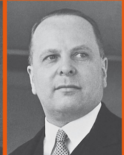
Georges Wander 1898 – 1969