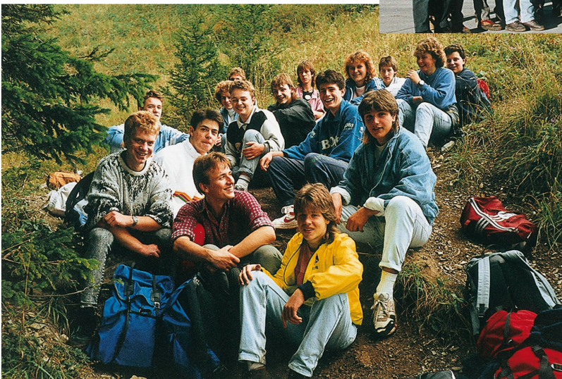
Lehrlingsausflug auf das Briener Rothorn, September 1989