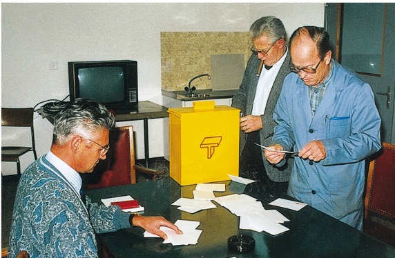
Wahl der Angestellten-Kommission, 1987