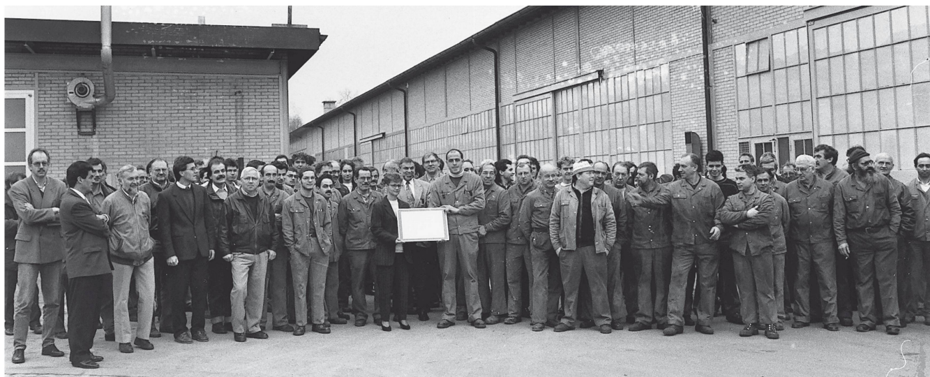
Zertifikatsübergabe ISO 9001 im Dezember 1994 im Beisein von Mitarbeiterinnen und Mitarbeitern