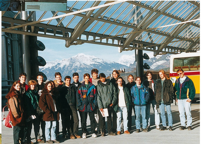
Lehrlingsausflug 1995 (die Gruppe unter dem Dach der Postautostation Chur)