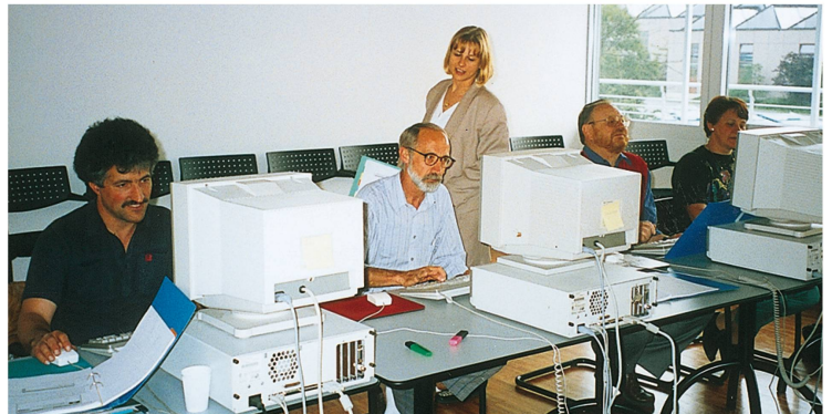
Interne PC-Schulung, 1994