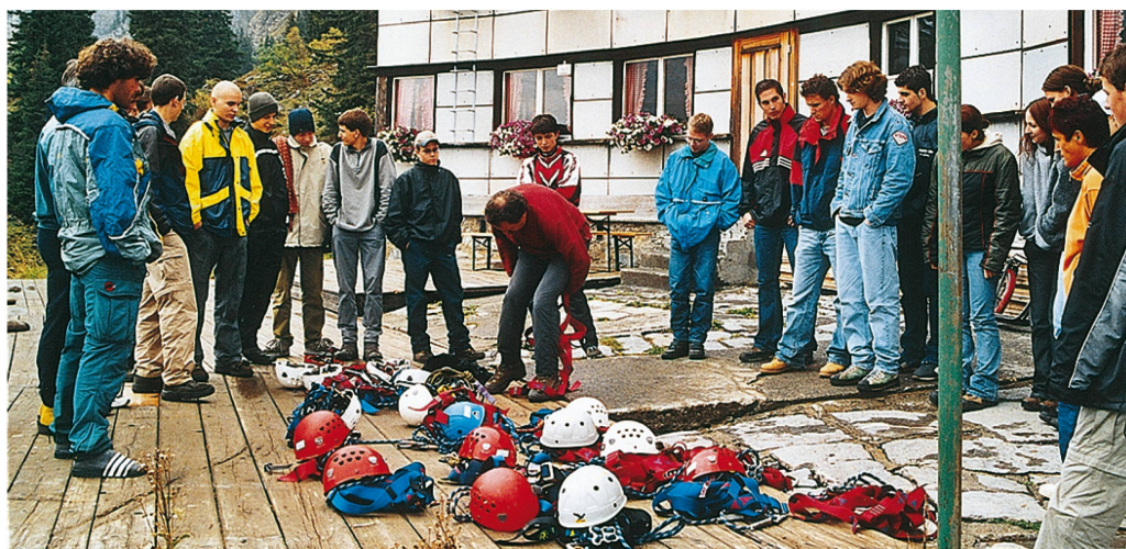
Lehrlingsausflug 2002 zum Klettersteig Braunwald

Um den Zusammenhalt unter den Lehrlingen zu fördern, werden regelmässig gemeinsame Aktivitäten durchgeführt.