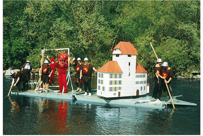
Flossrennen auf der Sitter, 1989