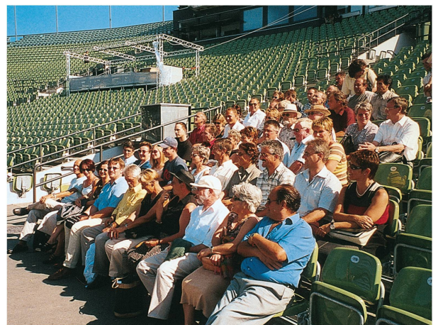
Vor der Seebühne Bregenz, 2003