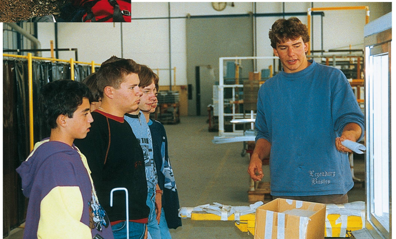
Lehrlinge zeigen ihren Arbeitsplatz am Tag der offenen Tür für zukünftige Lehrlinge im September 1994