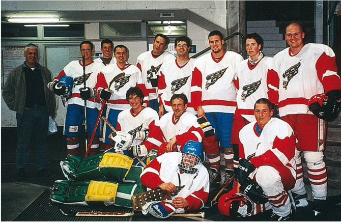
Eishockey-Turnier in Weinfelden, 2003