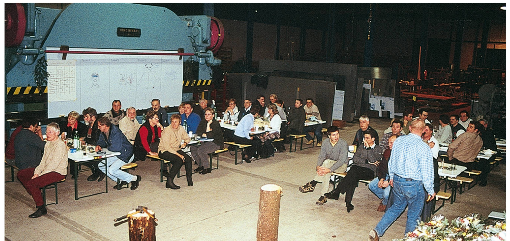
Weihnachtsessen in der Metallbauhalle, 2001