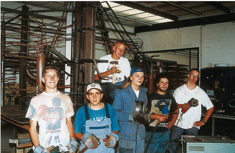
Lehrlinge bauen eine Kugelbahn für die 750-Jahr-Feier der Stadt Frauenfeld, 1996