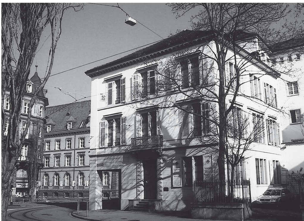
Haus zum Neuen Eck, Leonhardsgraben 3 im Jahr 2002. Bis 1907 Domizil der Bank Rudolf Kaufmann & Cie.