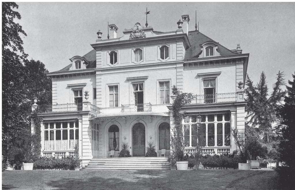
Villa Belle Fontaine an der Gellertstrasse 15 in Basel