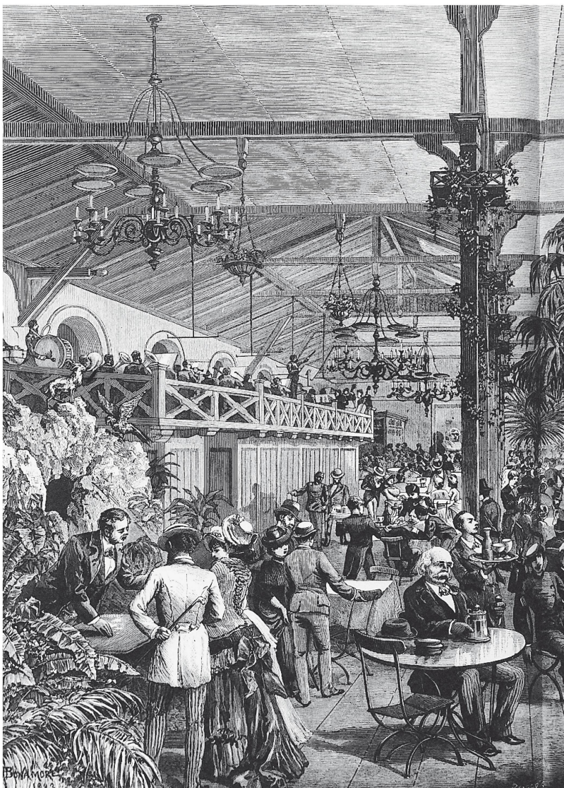
Zürcher Tonhalle mit Palmengarten – Treffpunkt kulturell Interessierter