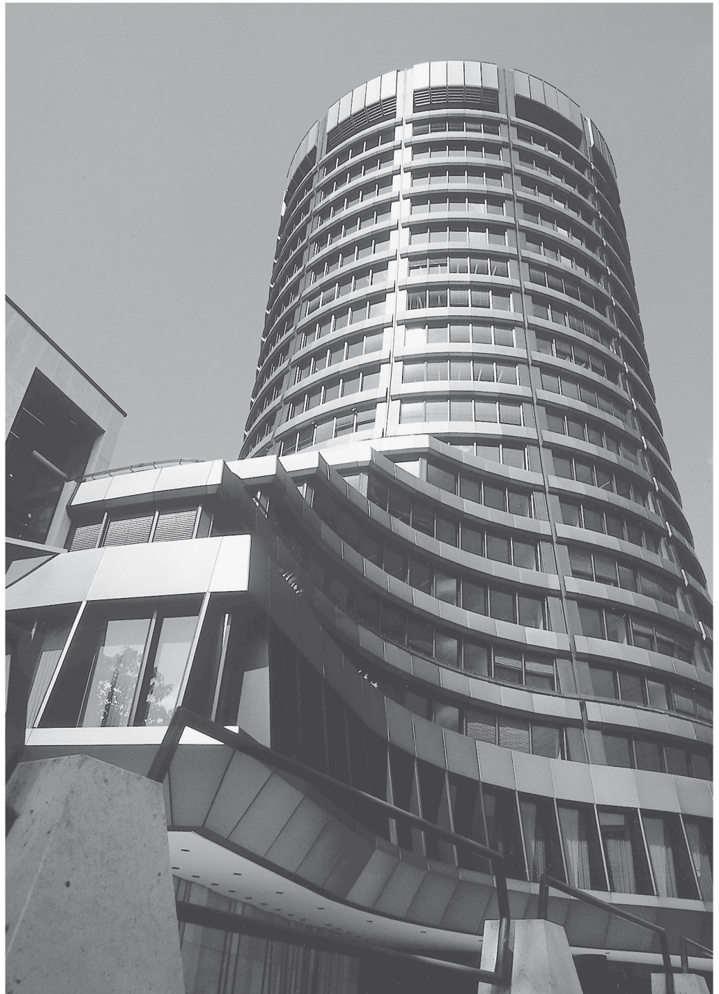
Das 1977 errichtete Turmhochhaus der 1929 gegründeten Bank für Internationalen Zahlungsausgleich (BIZ) an der Nauenstrasse 2/4

Nach erfolgreichem Lehrabschluss 1878 ging Rudolf Albert Koechlin für seine bankfachliche und sprachliche Weiterbildung nach Paris. In der Seinstadt absolvierte er auf Empfehlung seiner Lehrmeister ein Volontariat bei der Firma Ernest Morel & Cie.