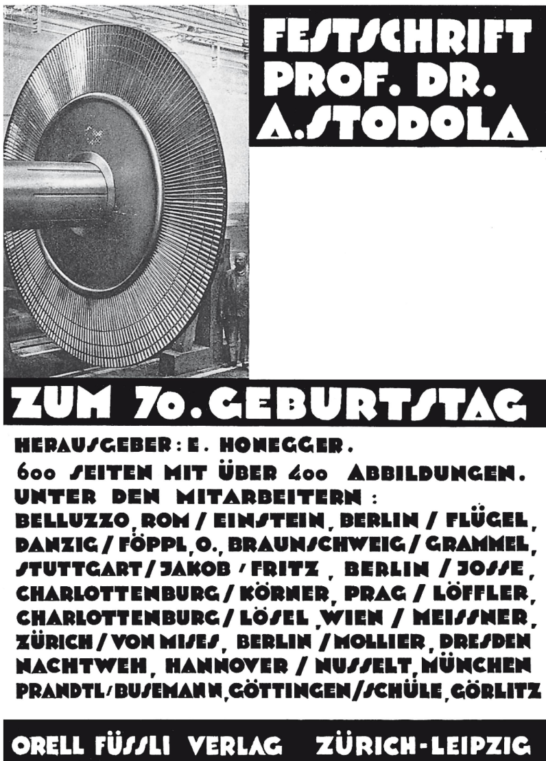
Buchumschlag der Festschrift zu Stodolas 70. Geburtstag 1929

Der wachsende Ruhm Stodolas veranlasste verschiedene ausländische Hochschulen, ihn mit attraktiven Versprechungen aus der Schweiz wegzulocken. Darunter waren so renommierte Schulen wie diejenigen von Harvard, Petersburg, Wien, Prag, Hannover und Karlsruhe. Stodola hätte den schmeichelhaften Angeboten wohl kaum widerstanden, wäre er nicht überzeugt gewesen, dass nur Zürich ihm ein solch ideales Umfeld für seine fruchtbare und erfolgreiche Forscherlaufbahn bieten konnte. Er blieb der ETH ganze 37 Jahre lang treu und trat erst nach Vollendung seines 70. Altersjahres von seinem Lehramt zurück.