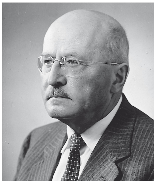
Bild unten rechts: Claude Seippel (1900–1986), Erfinder des Druckwellenladens «Comprex»

Bild unten links: Adolf Meyer (1880–1965), Pionier der Gleichdruck-Gas- turbine