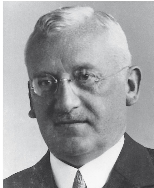
Bild unten links: Adolf Meyer (1880–1965), Pionier der Gleichdruck-Gas- turbine

Bild oben rechts: Walter Noack (1881–1945), Erfinder des «Velox»-Dampf- kessels