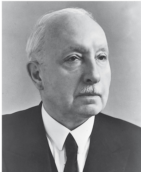
Bild oben rechts: Walter Noack (1881–1945), Erfinder des «Velox»-Dampf- kessels

Bild oben links: Alfred J. Büchi (1879–1959), Erfinder der Turboauf- ladung