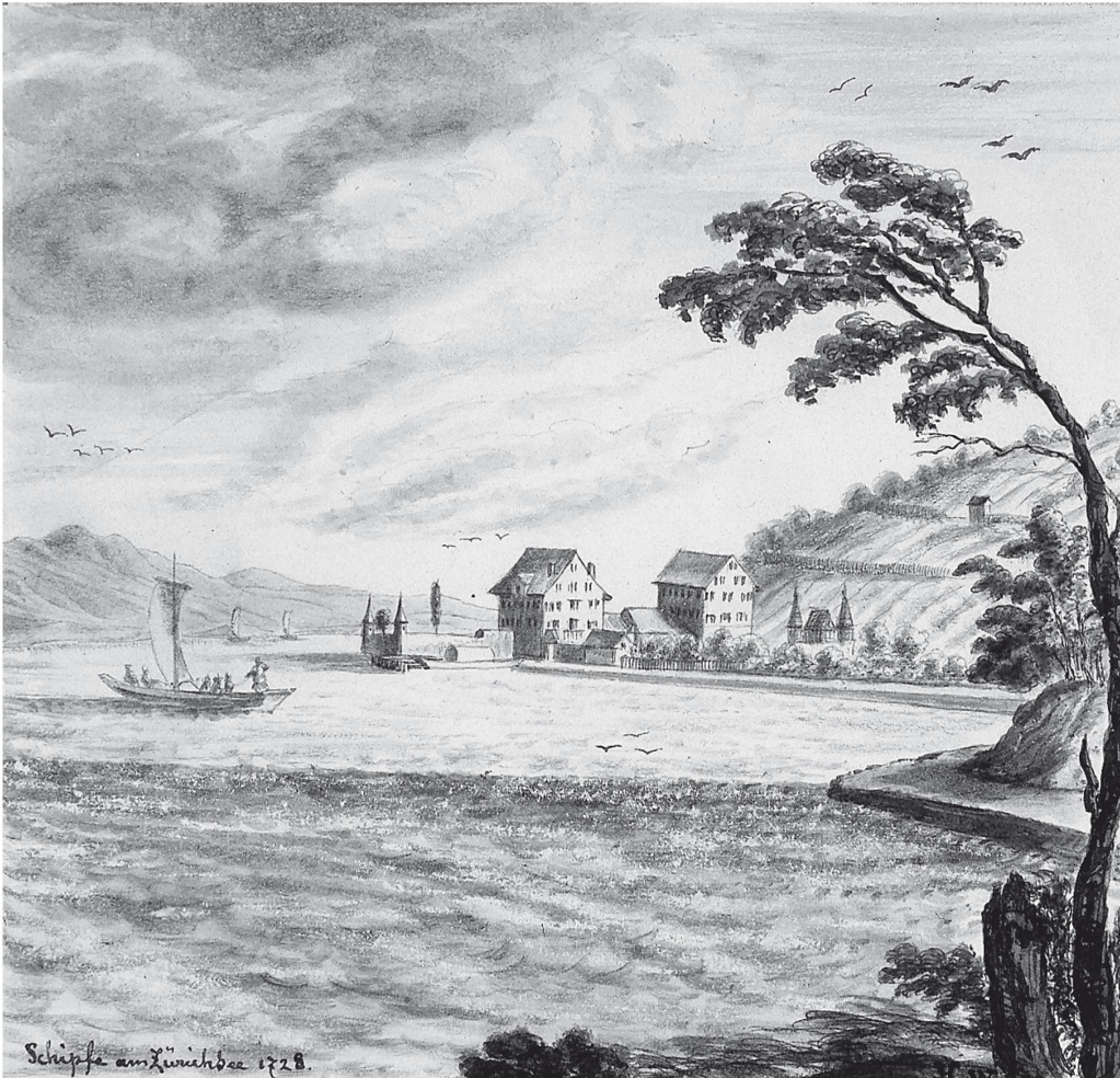
Die Schipf in Herrliberg. Sepiazeichnung von J.C.W., 1728

stanz, die ihres Glaubens wegen in Zürich nicht akzeptiert wurde und deshalb aus einer gewissen Trotzreaktion heraus begann, ungeheuren Luxus zu entfalten, entstand im Jahre