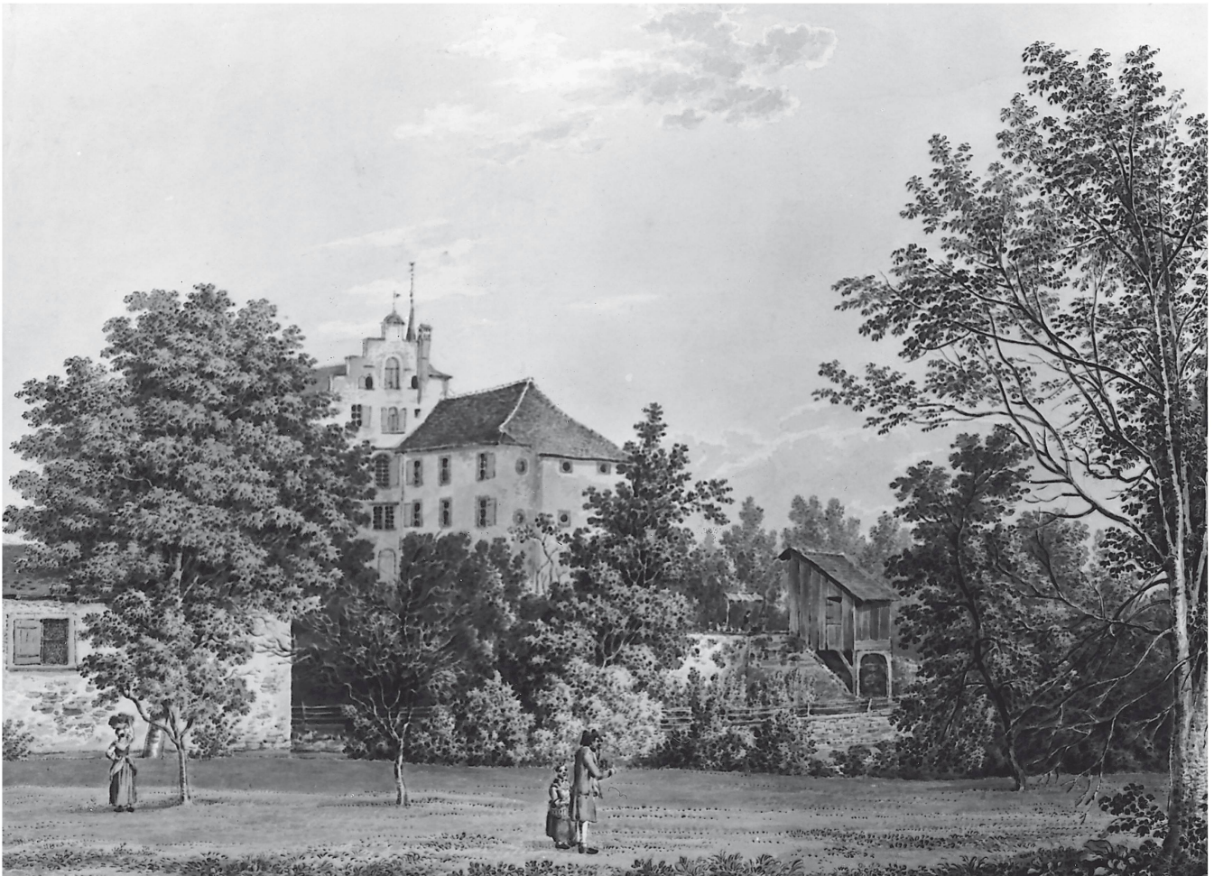
Der Alte Seidenhof. Aquarell von J. H. Füssli, um 1805

reits auf den Export ausgerichtet. Die Woll- und Leinenweber dagegen arbeiteten in Zürich zu Beginn des 16. Jahrhunderts noch ausschliesslich für den städtischen Markt.