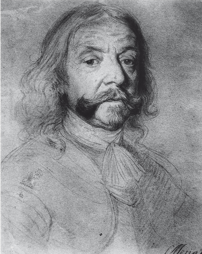
General Hans Rudolf Werdmüller (1614–1677). Kreidezeichnung von Matthäus Merian d. J., 1676