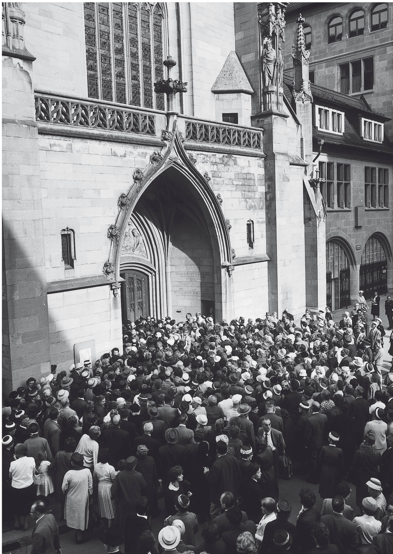
Tausende strömten zur Abdankung in die vier Altstadtkirchen von Zürich, auf dem Bild vor dem Eingang zum Fraumünster.