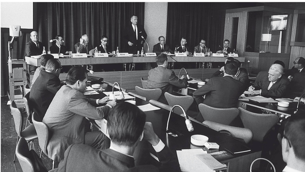
Am 1. September 1963 wurde das Gottlieb Duttweiler Institut in Rüschlikon feierlich eröffnet, das bald zu internationalem Ansehen gelangte.

1963 wurde die Institution eröffnet, die als Denkmal für den grossen Schweizer gelten darf: das Gottlieb Duttweiler Institut (GDI) in Rüschlikon, das sich seither als international ausgerichtete «Denkfabrik» und als Studien- und Tagungsstätte für wirtschafts- und sozialpolitische Fragen einen hervorragenden Namen gemacht hat.