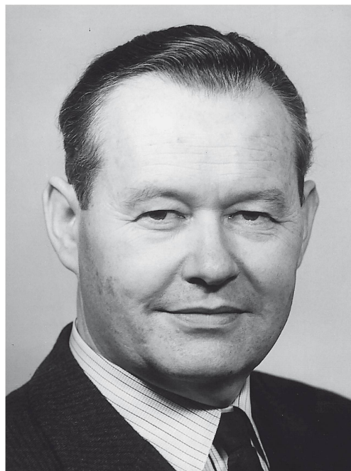
Hans Schaffner (geb. 1908), Bundesrat von 1961 bis 1969

Als Herr Bundesrat Wahlen seine Kandidatur aufstellen liess, erschien seine Wahl nicht zum voraus gesichert. Deshalb sprachen wir in zuständigen Kreisen unserer Genossenschaften und in der Landesringfraktion sehr positiv über ein Angebot an Herrn Dr. F. Wahlen, in oberster Stellung in die Verwaltung des Migrosbundes einzutreten. Diese dritte Kraft in Wirtschaft und Politik (dank dem Referendum) unseres Landes bedarf Männer von Charakter und aussergewöhnlichen Fähigkeiten, hauptsächlich deshalb, weil sie zum Wohle des Landes und darüber hinaus eingesetzt werden muss für alle Zeiten, solange diese geistige Bewegung besteht. Allein die