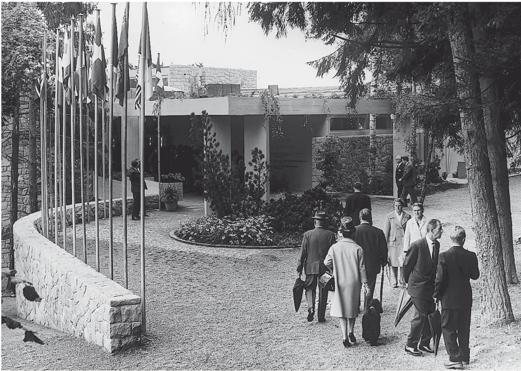
Eingang zum Gottlieb Duttweiler Institut in Rüschlikon, zu dem im Februar 1962 der von schwerer Krankheit gezeichnete Duttweiler den Grundstein gelegt hatte