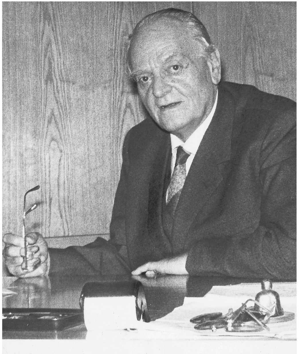
Letzte Aufnahme von Gottlieb Duttweiler in seinem Büro 1961