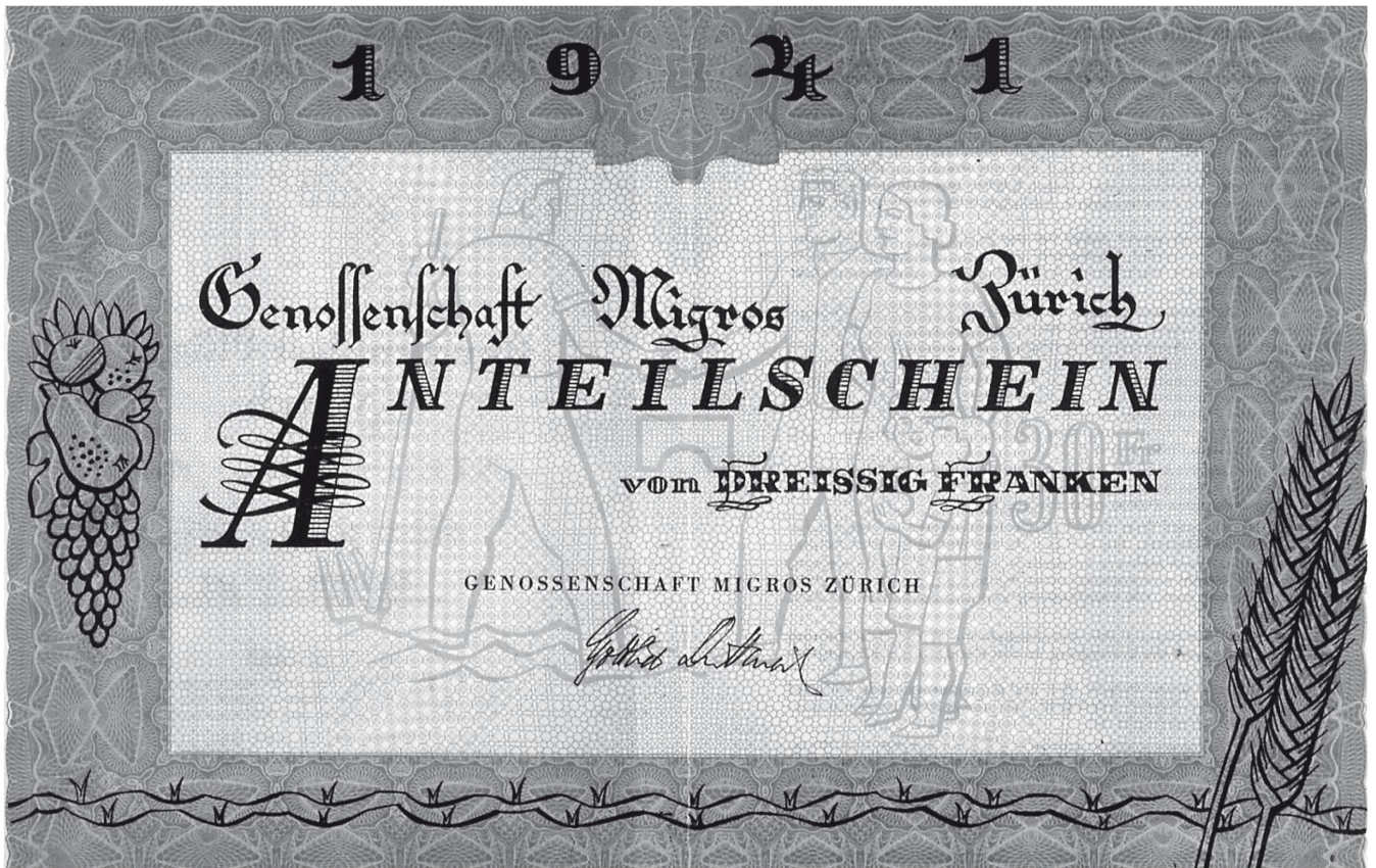
Erster Anteilschein der Migros-Genossenschaft

hinderung. Irgendwann würde sich die Frage stellen, wie sich all das vereinbaren liesse mit der Tatsache, dass er als Alleineigentümer eines auf 16 Millionen (damalige!) Franken geschätzten Konzerns selber einer der eminenten Kapitalisten des Landes war.