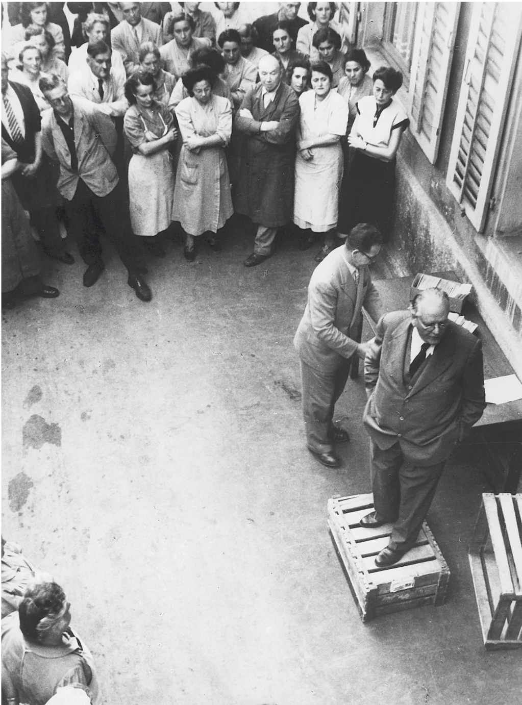
Für Gottlieb Duttweiler war der enge Kontakt mit den Mitarbeiterinnen und Mitarbeitern wichtig.