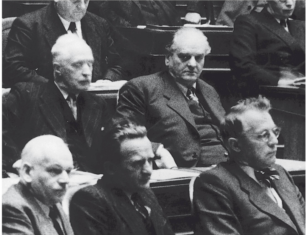
Gottlieb Duttweiler als eidgenössischer Parlamentarier

Erfolg und Wirkung sind zweierlei, zumal in der Politik. Gottlieb Duttweiler war nach dem erdrutschartigen Wahlsieg von 1935 ein erfolgreicher Politiker, aber die Wirkung, die er auf den Gang der eidgenössischen Dinge ausübte, hielt sich in engen Grenzen. Er mochte angreifen und bewegen, so viel er wollte: Die Blöcke der Linken und der Rechten liessen ihre Schwerkraft wirken, und an der schweizerischen Wirklichkeit änderte sich wenig. Der von beiden politischen Polen her gleicherweise angefochtene Oppositionspolitiker musste sich gut überlegen, auf welche Themenfelder er sich konzentrierte – und welche Themen, auch wenn sie ihm wichtig gewesen wären, er besser unbearbeitet liess.