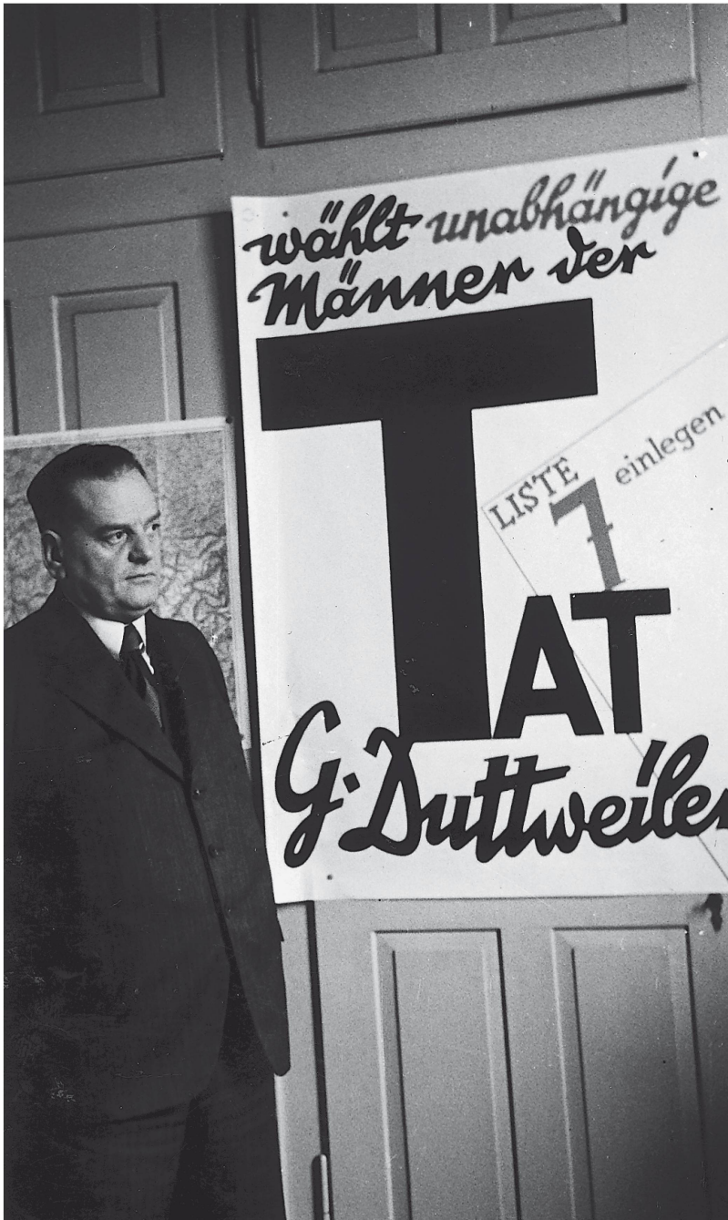
Gottlieb Duttweiler vor dem ersten Plakat für seine erste Beteiligung an den Nationalratswahlen 1935