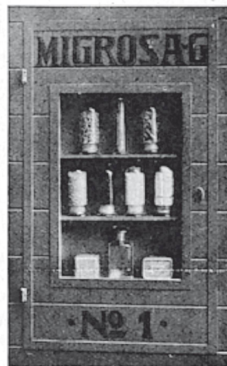
LADEN - neue appetitliche Wagen - hygienische Verpackungen