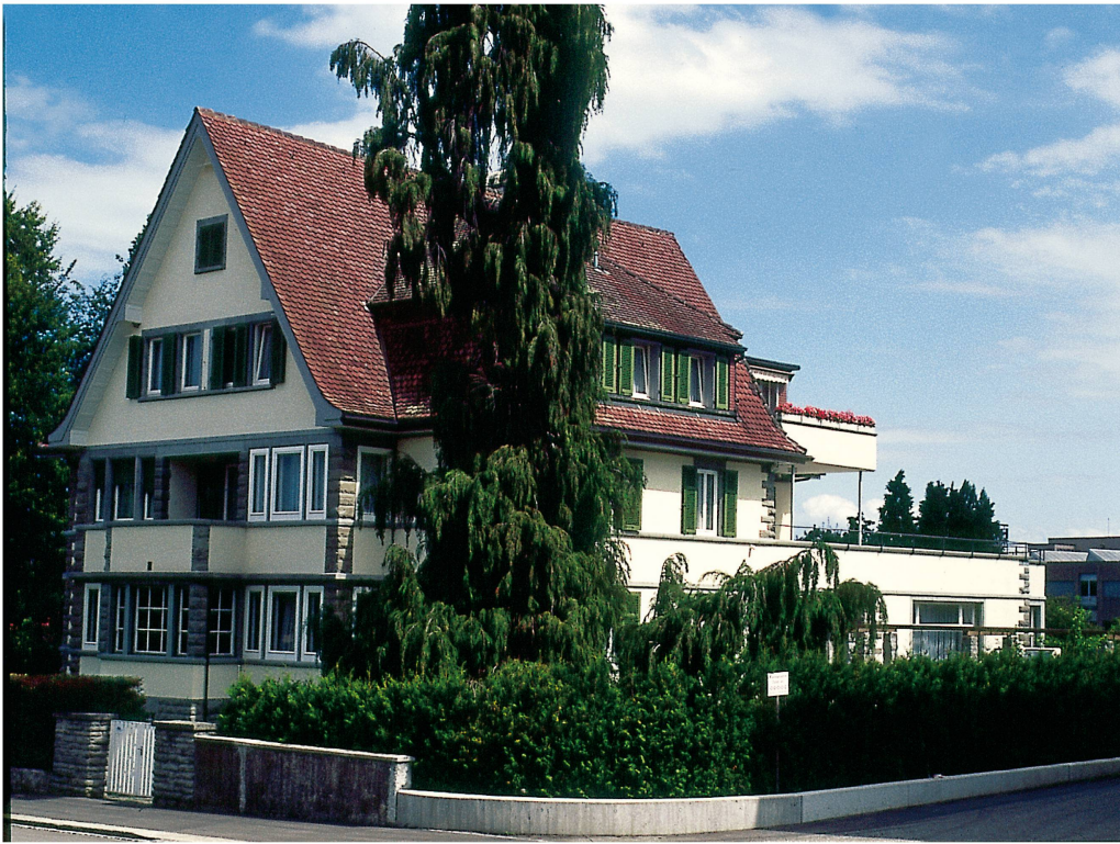
Die 1997 renovierte Villa Seeburg

schaffen, die er geduldig ertrug. Er starb am 24. April 1991.