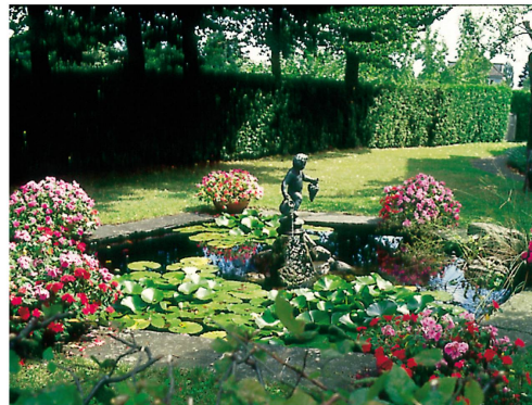
Der Garten der Villa Seeburg