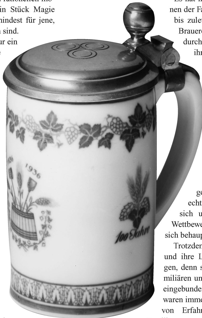
Der Krug zum 100jährigen Bestehen

Ludwig Marcuse hat einmal gesagt: «Man verwechsle nicht, was in den Geschichtsbüchern steht, mit dem, was einer, dessen Zeit sie beschreiben, durchgemacht hat.»