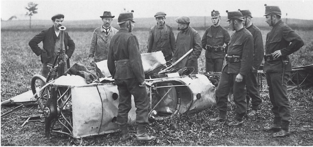
In der Nacht des 10. Septembers 1913: Harte Landung in Kirchlindach bei Bern (Bider und Real kommen mit einigen Schrammen davon.)

den und im nächsten Augenblick gibt es einen Krach. Ich fliege durch den Spannturm und lande in verkehrter Fahrriichtung am Boden. (...) Der Apparat liegt auf dem Rücken, Bider unter ihm; oder viel mehr in ihm. Er stöhnt. (...) Ich reisse die Blechverschalung weg und ziehe Bider hervor. Er ist auch ganz, bummelt herum und lacht! Er lacht etwas eigentümlich, aber, wenn einer seine Glieder alle beisammen hat und lacht, dann stirbt er noch nicht.»