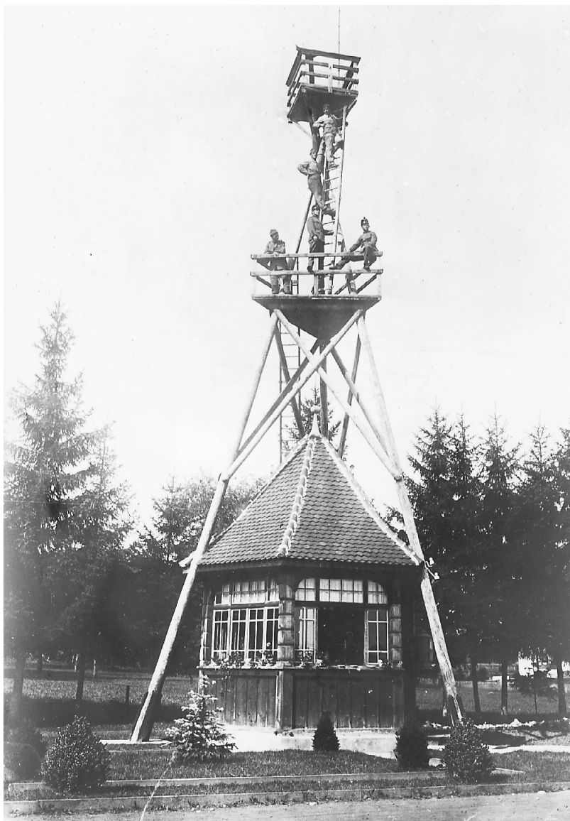
Dübendorf 1915: Das von Theodor Real konzipierte Büro des Kommandanten mit Starthäuschen und Wet- terturm – alle drei zu einem vereint

Der Glaube an die Zukunft hielt die kleine Fliegerabteilung unter Real trotz aller Widerwärtigkeiten vorerst aufrecht und zeitigte erfreuliche Resultate. Am 30. September 1915 erfolgte die Brevetierung der ersten in der Schweiz ausgebildeten Militärpiloten Lüthy, Reynold und Pillichody. Probst und Vollenweider waren die ersten Opfer der Luftwaffe; Real liess