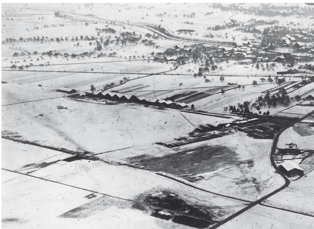
Der Flugplatz Dübendorf 1916

Bis zu diesem Zeitpunkt hatte Real dem Staat mehr als zehn Jahre uneigennützig gedient. Nach ein paar