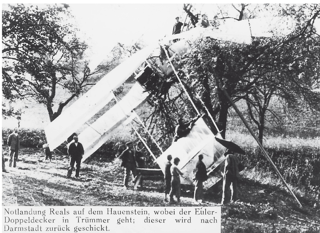
Notlandung Reals auf dem Hauenstein, wobei der Euler-Doppeldecker in Trümmer geht; dieser wird nach Darmstadt zurück geschickt.