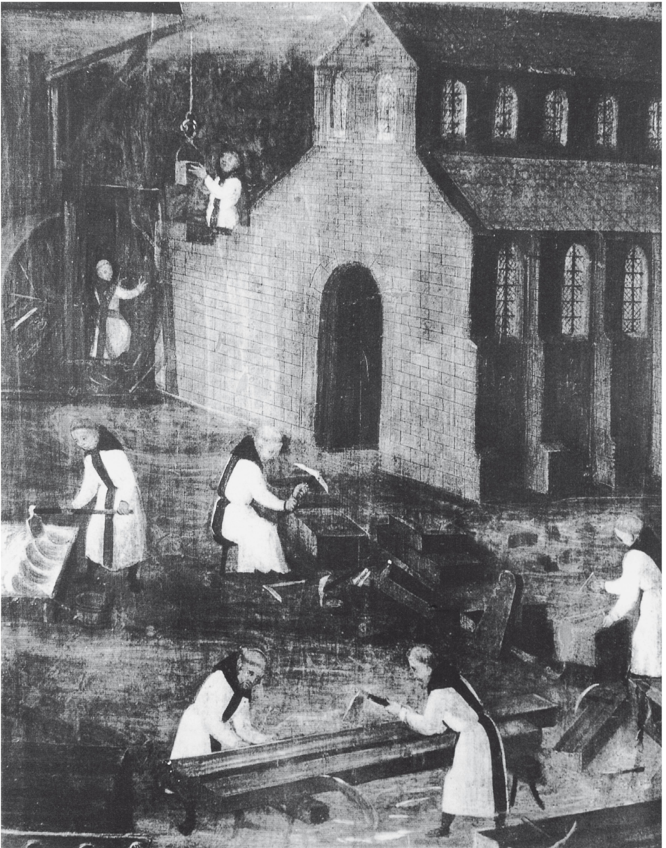
Mönche bauen die Abteikirche von Maulbronn, Baden-Württemberg. Ölgemälde, 1450.

Urkunden nennen sie nicht. Als einfache Brüder sind sie im Gedächtnis der Geschichte zumeist namenlos geblieben. Mit Namen und individuellen Zügen werden einzelne Laienbrüder