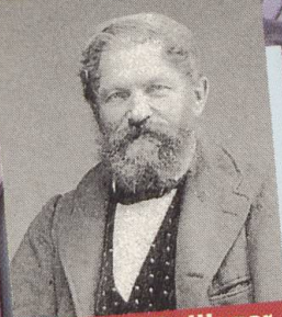
Abraham Geilinger 1820–1880

Schweizer Pioniere der Wirtschaft und Technik