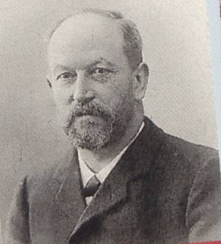
Gottlieb Geilinger 1853–1927