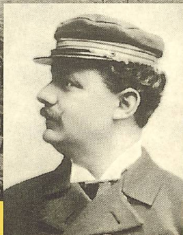
Eduard Spelterini 1852–1931