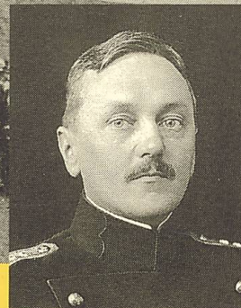
Emil Messner 1875–1942