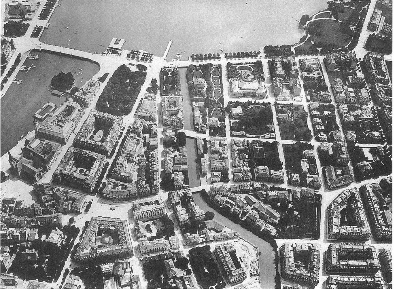
Diese Luftaufnahme des Ballonfahrers Eduard Spelterini aus dem Jahre 1907 zeigt einen grossen Teil von Bürklis Tätigkeitsgebiet: Quaianlagen mit Quai- brücke, Fraumünster- quartier, Bahnhof- strasse und Paradeplatz.