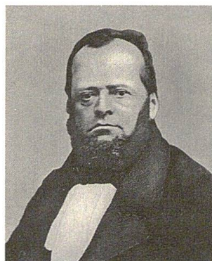
Ferdinand Ernst 1819–1875

Vom gewerblichen zum industriellen Brauen