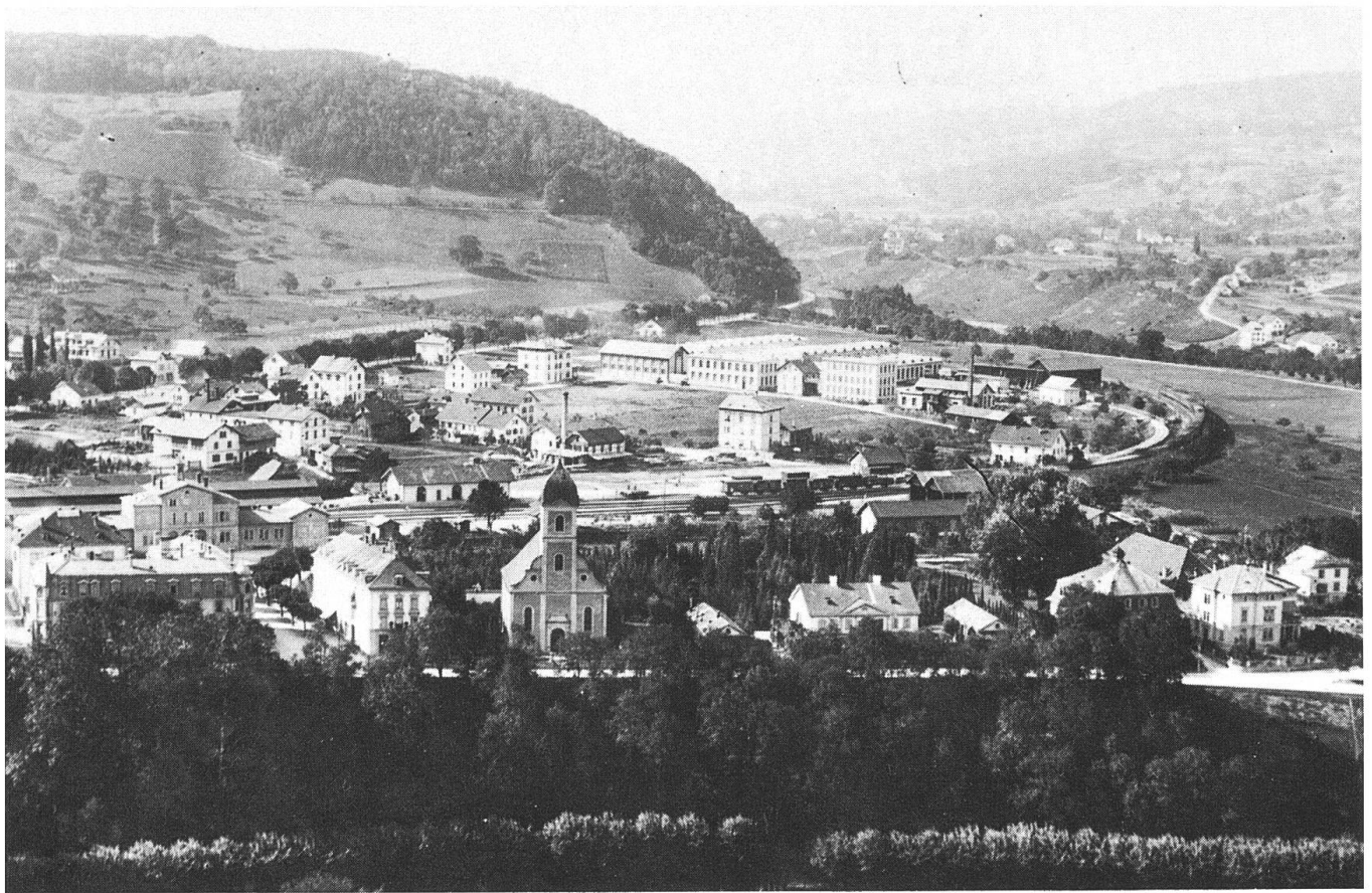
Die Werkhallen und Bürogebäude von Brown Boveri kurz nach der Gründung...