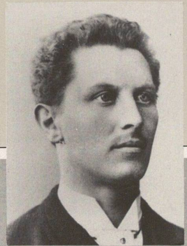
Walter Boveri 1865–1924