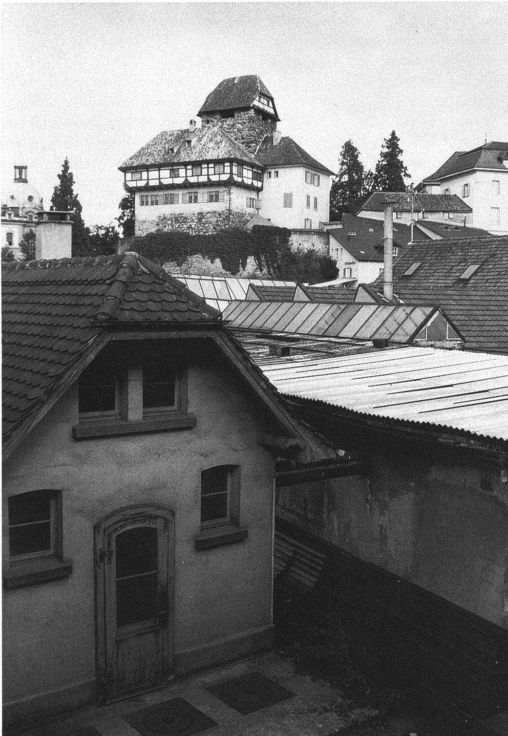
Teile des ehemaligen Fabrikareals von Martini im Jahre 1990; im Hintergrund das Wahrzeichen von Frauenfeld, das mittelalterliche Schloss.

glements grosse Unterschiede bestanden. Die Schutzwirkung von Fabrikgesetz und Fabrikordnung war daher noch sehr gering.