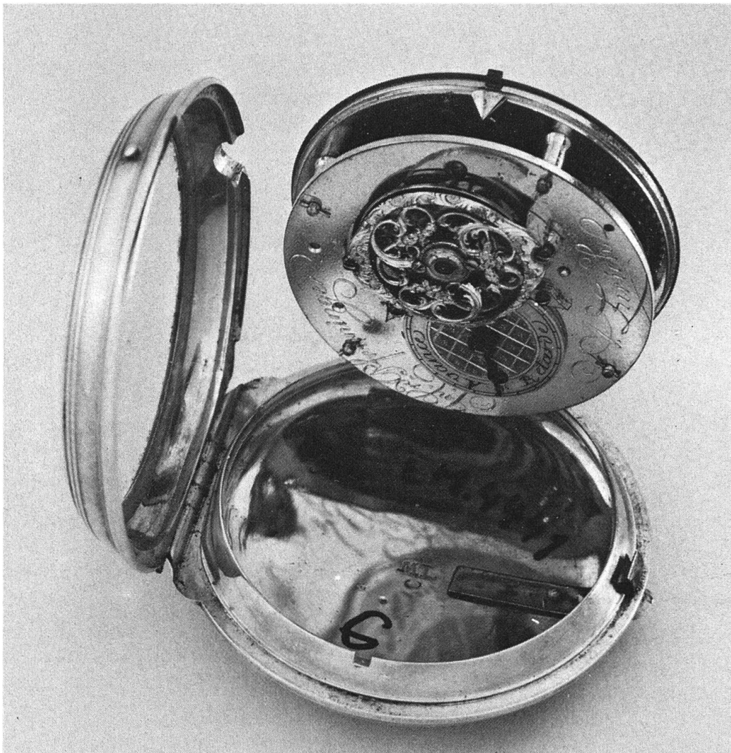
Taschenuhr, Erinnerungsstück an die Ausbildung in Zürich (vgl. S. 10)