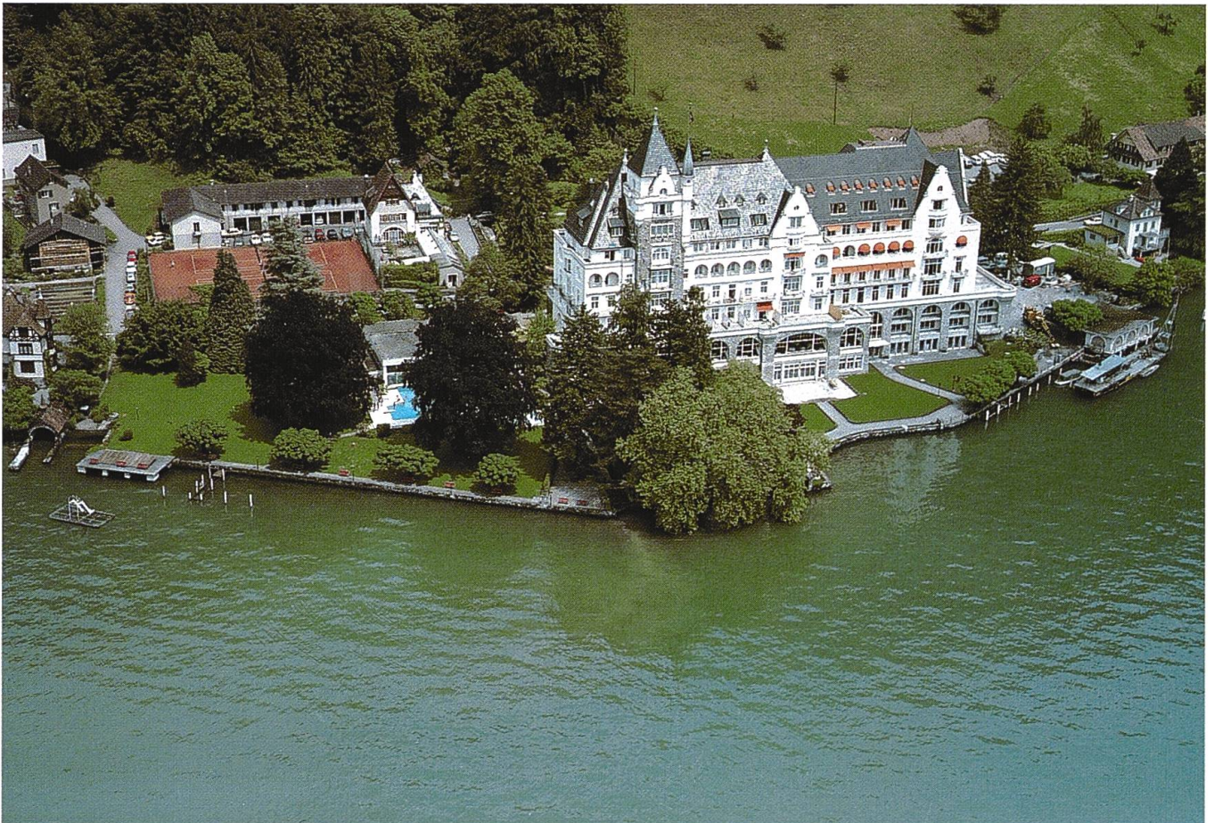
Renovation und Erweiterung des Parkhotels Vitznau