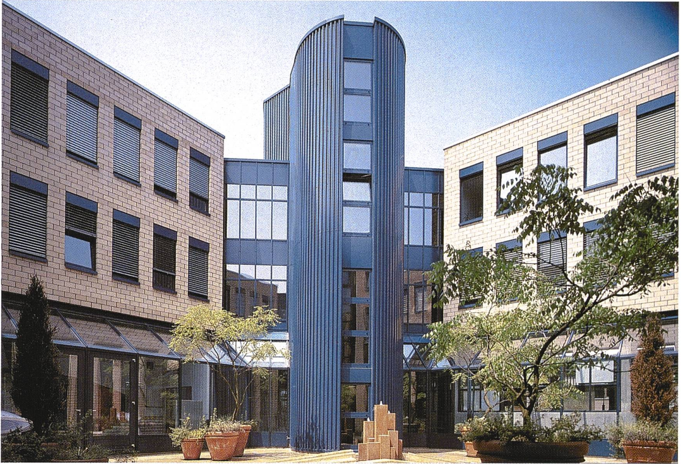
Neubau für die Stäfa Control System AG