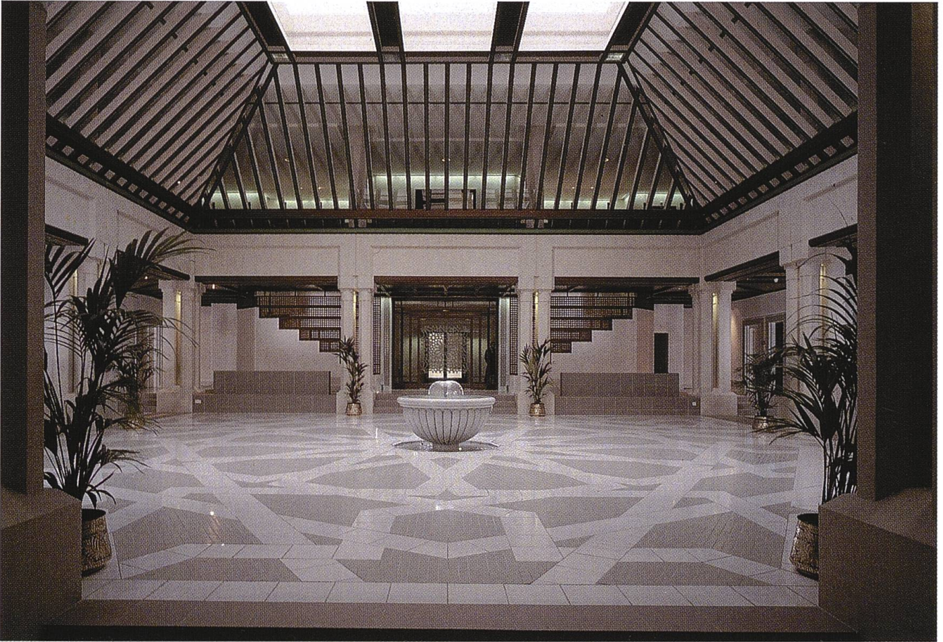
Neubau für die Saudiarabische Botschaft in Genf