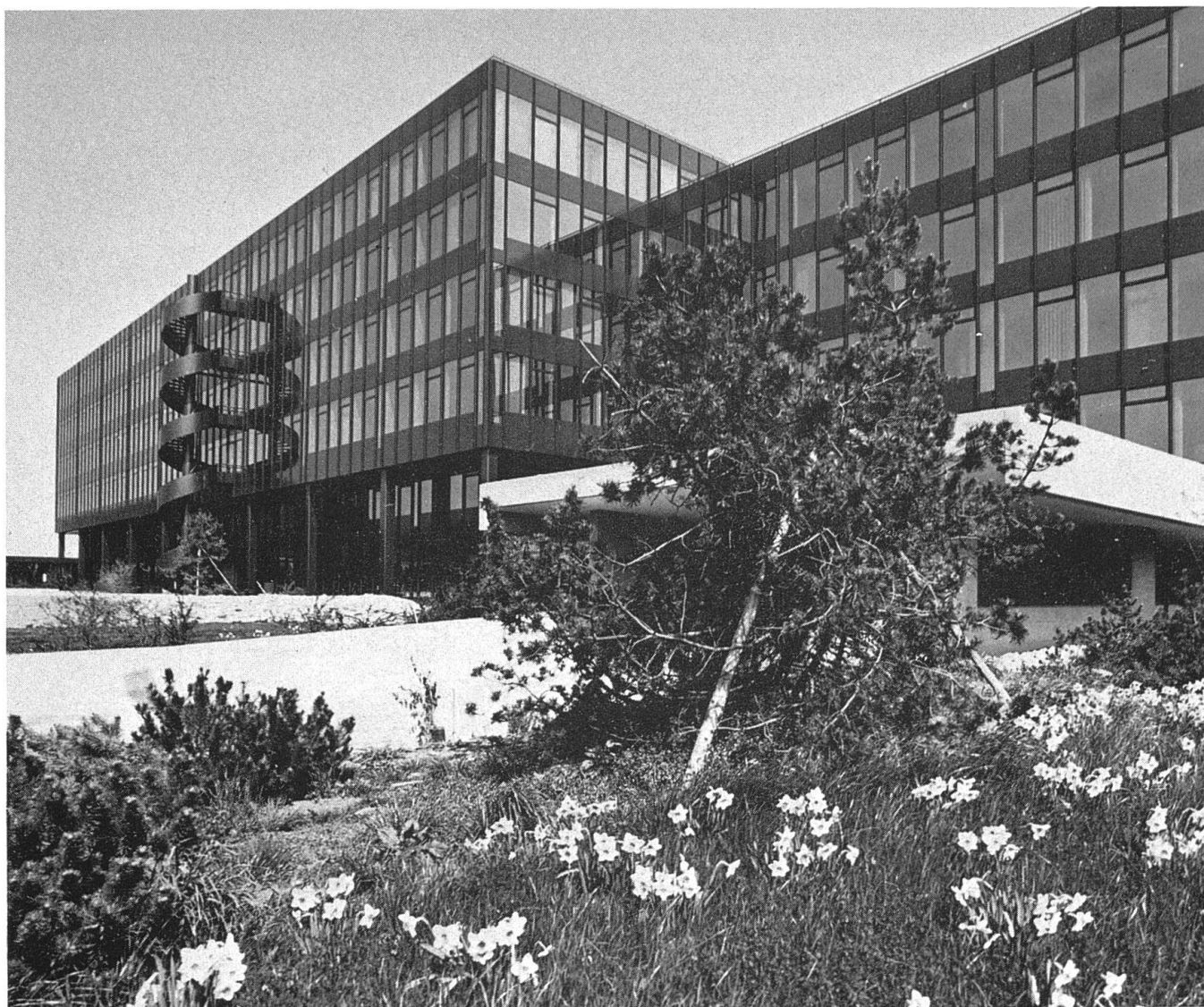
1971–1976: ETH Zürich-Hönggerberg

weise einen Teil der Bauten der Eidgenössischen Technischen Hochschule auf dem Hönggerberg erstellt, ebenso das Fernsehzentrum DRS in Seebach und konnte 1989 den richtungweisenden Neubau der Zürcher Börse im Selnau übernehmen. Die Göhner AG ist auch stark engagiert beim Projekt HB-Südwest, einer Überbauung des Geleiseareals des Hauptbahnhofs Zürich mit einem Dienstleistungszentrum und Zusatzbahnhof. Auf über achtzig weiteren Baustellen in der Schweiz findet sich momentan der Name Göhner. Dazu kommen rund 15 000 Mietobjekte, die verwaltet werden – kurz, die Göhner AG handelt durchaus im Sinne ihres Gründers.