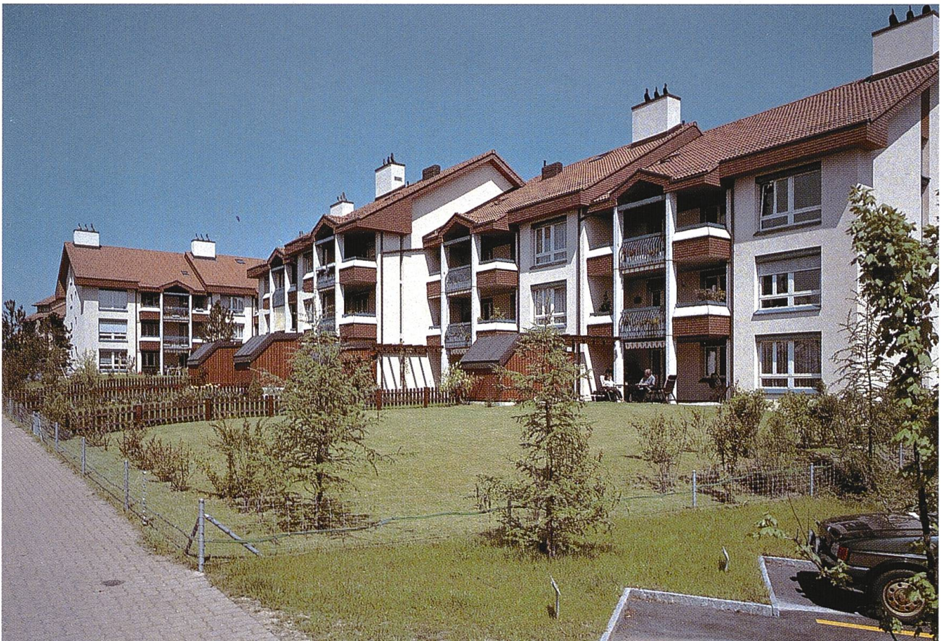
Wohnüberbauung Chrüzacher in Brütisellen