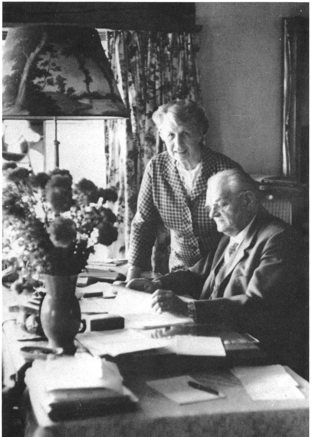
Gottlieb und Adele Duttweiler. Frau Duttweiler spielte im Leben und Wirken ihres Mannes eine bedeutende Rolle.

Immer wieder musste man feststellen, rückblickend habe Duttweiler recht gehabt. Gewiss, er betonte das auch selbst. Man könnte also sagen, Duttweiler sei der grosse Rechthaber der Schweiz des 20. Jahrhunderts gewesen. Darüber hinaus aber war er eine der bedeutendsten Persönlichkeiten seiner Generation in diesem Land, weit in die Welt hinausschauend und dennoch tief verwurzelt im schweizerischen Boden.