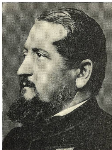
ABRAHAM GANZ 1814-1867